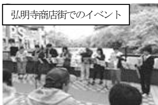
弘明寺商店街でのイベント