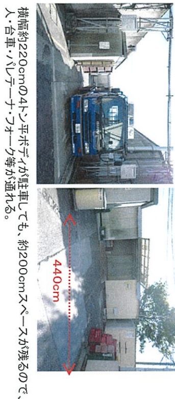
横幅約220cmの4トン平ボデーが駐車しても、約200cmスペースが残るので、人・台車・ハレテナー・フォーク等が通れる。