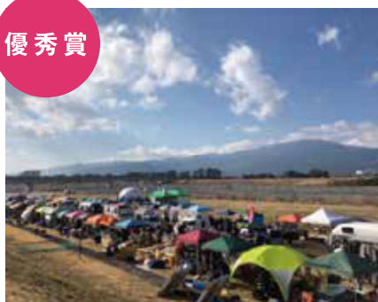
「アシガラルムシェ」 松田活性化協会