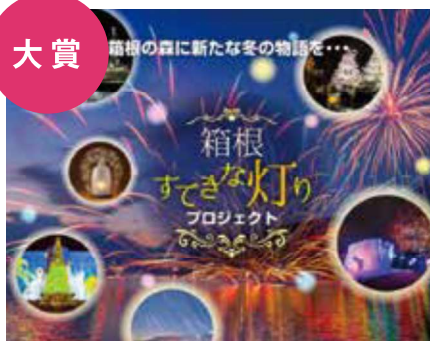
「箱根すてきな灯り プロジェクト」 箱根プロモーションフォーラム