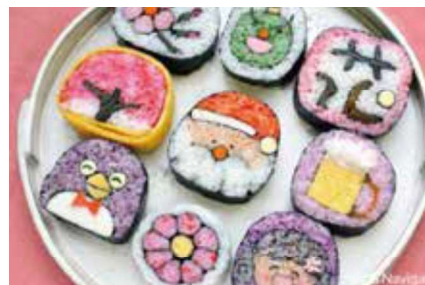
「ようこそ神奈川へ!観光客向け絵巻寿司教室」 巻き寿司教室ぐるり