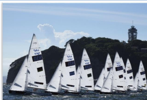
<セーリング競技の様子②>