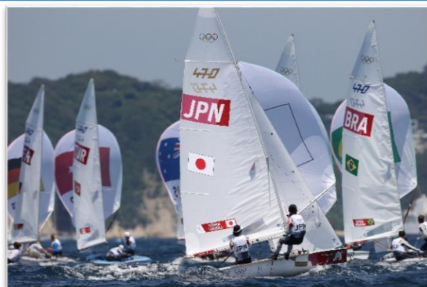
<セーリング競技の様子①>