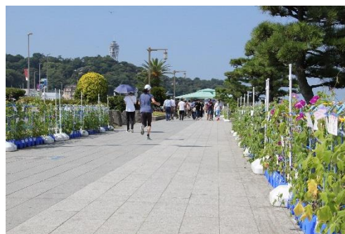
＜アサガオの鉢植えが並べられた歩道＞

※県の取組とは別に、組織委員会による同様の取組も行われ、藤沢市立小学校が参加しました。