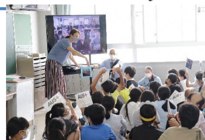
＜オーストラリアの小学生とオンラインで交流する様子＞

オリンピック セーリング村が設置された大磯町の大磯小学校と国府小学校では、オリンピックの直前にセーリングの強豪国であるオーストラリアの小学校とオンラインでつなぎ、オーストラリアの小学生と英語を使って様々な話をして交流しました。