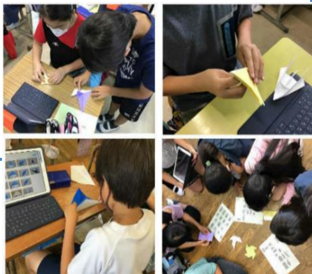
<歓迎の気持ちを込めて折り紙を折る子どもたち>

オリンピック セーリング村が設置された大磯 町の大磯小学校・国府小学校の子どもたちが歓迎 の意を込めて、たくさんの折り紙を折りました。