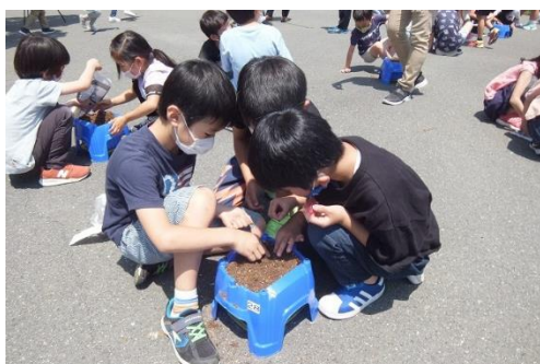
＜子どもたちがアサガオの種を植える様子＞