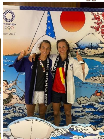
＜記念フォトパネル＞