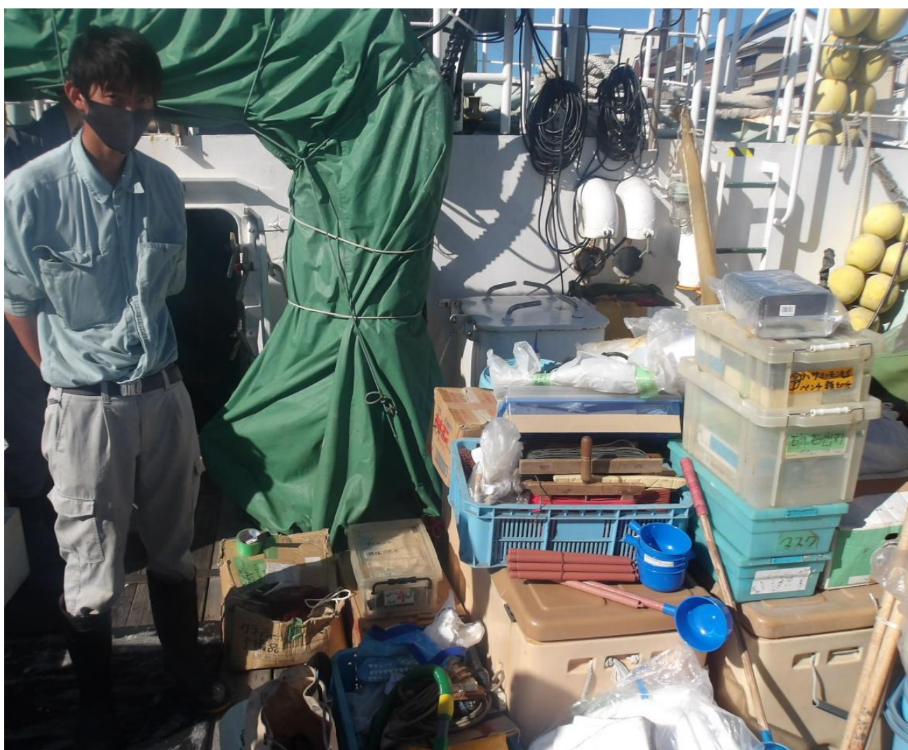
物品の一部を倉庫外に出して在庫管理と環境整備を行った状況

船舶を安全に運航させるには、甲板長の適切な物の管理が必要不可欠です。 甲板長という仕事の地道な努力を少しでもご理解いただけますと幸いです。