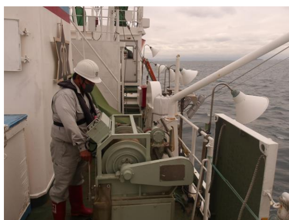
操業場所の海洋観測も重要な任務です