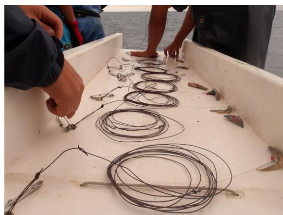
枝縄にエサを付け船尾端に送ります