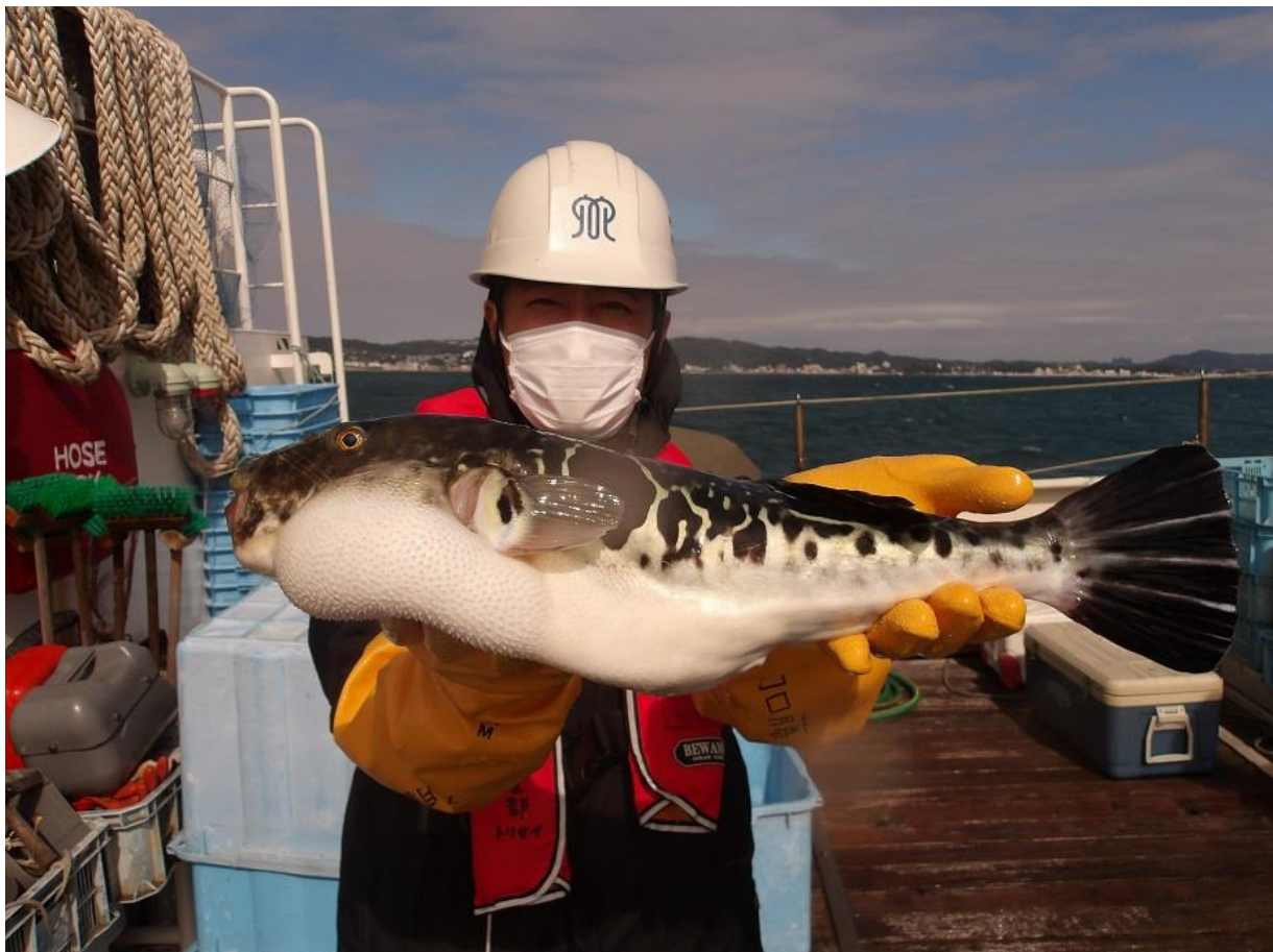
「江の島丸」にフクが来ました！ かながわブランド「相模のとらふぐ」です。