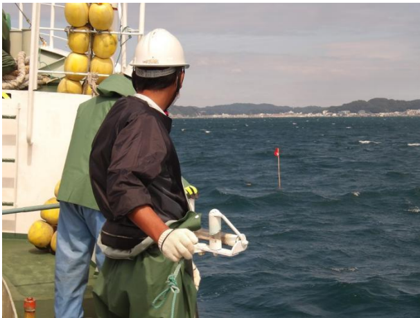
目印の旗を揚げて揚げ縄開始です