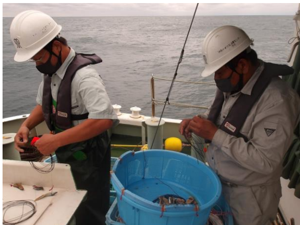
合計 240 本の針にエサを付けます