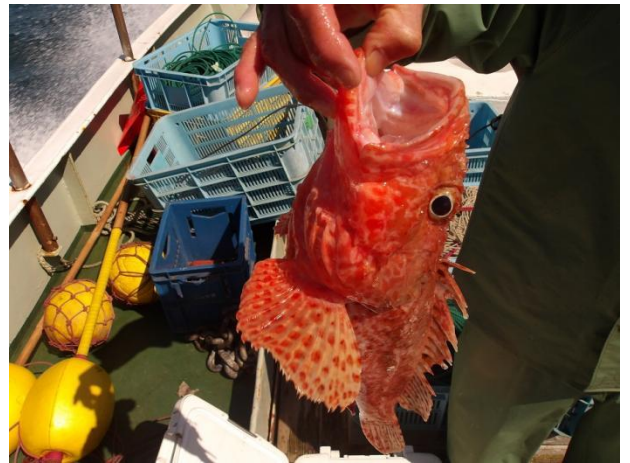
混獲されたさかなが揚がってきます