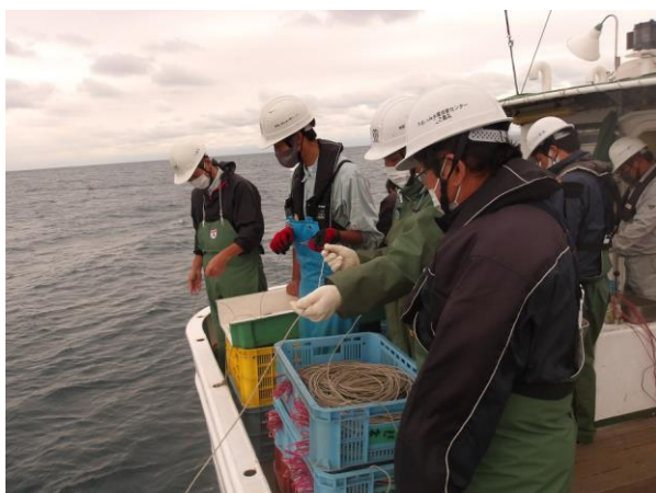
枝縄を幹縄に連結していきます