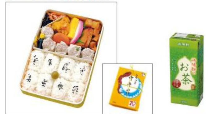
■シウマイ弁当(飲物付)