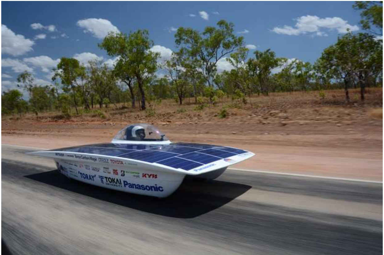
ソーラーカー（東海大学「15 Tokai Challenger」）写真