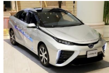
県公用車 FCV(トヨタ MIRAI)