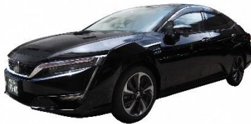
FCV ハイヤー(ホンダ CLARITY FUEL CELL)