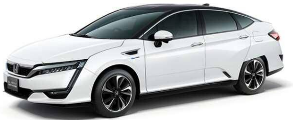
クラリティ FUEL CELL(ホンダ)