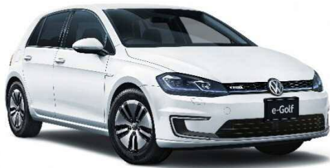
e-Golf(フォルクスワーゲン)