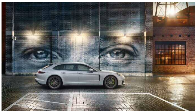
パナメーラ 4 E ハイブリッド(ポルシェ)