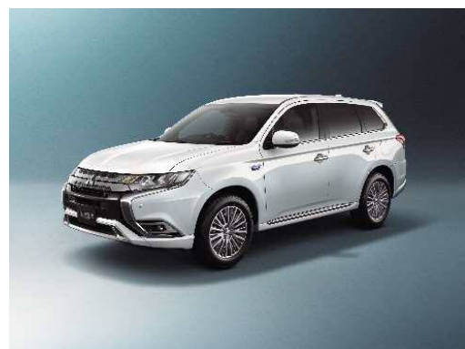
アウトランダーPHEV(三菱)