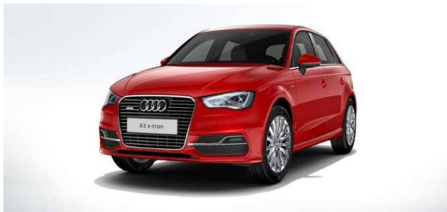
A3 Sportback e-tron(アウディ)