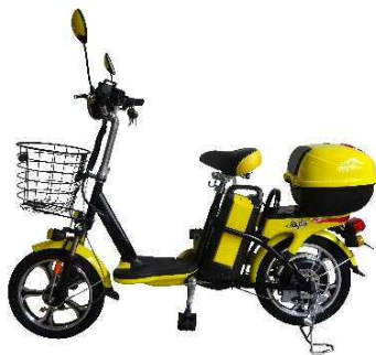
バイクルP3(バイクル)