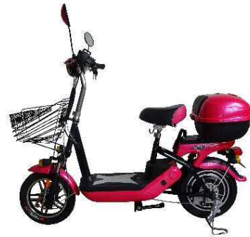
バイクルL6(バイクル)