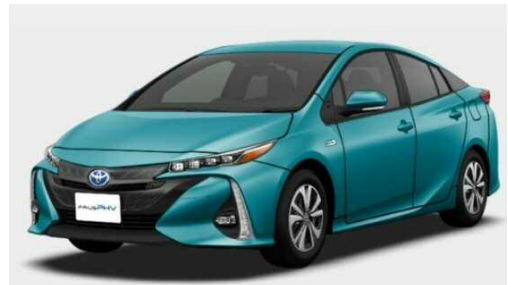
プリウスPHV(トヨタ自動車)