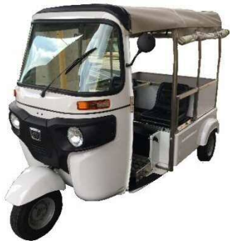
エレクトライク(日本エレクトライク)