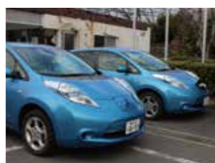
社用車に電気自動車を導入