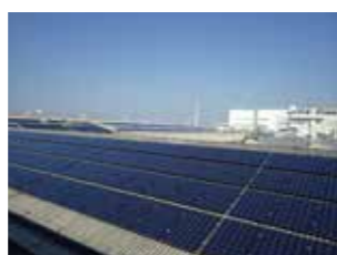
工場屋根の8割にソーラーパネル

この度、トノックスのソーラーシステム導入への取り組みが、神奈川県「薄膜太陽電池普及拡大プロジェクト」に採択されました。トノックスは、県内・県外を問わず工場や建物の多い地域で再生可能エネルギー活用の模範となるように努めています。