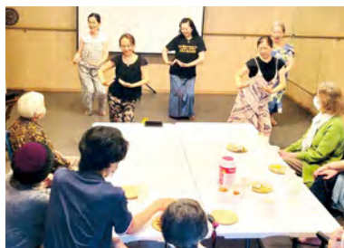
エシカルスタジオ 湘南

認知症の方やそのご家族もご参加頂けるワークショップを開催中!!一緒に踊りましょう!!