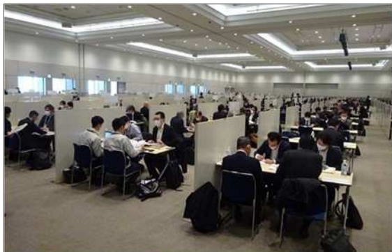
令和5年度に実施した「九都県市合同商談会2024」の商談風景 (会場: パシフィコ横浜 アネックスホール)

首都圏産業の国際競争力の強化を図るため、平成20年度から九都県市(埼玉県、千葉県、東京都、神奈川県、横浜市、川崎市、千葉市、さいたま市、相模原市)が連携して合同商談会を開催し、今回で第17回目を迎えます。