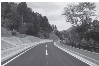
古在家バイパス整備