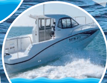
海上タクシー (貸切)