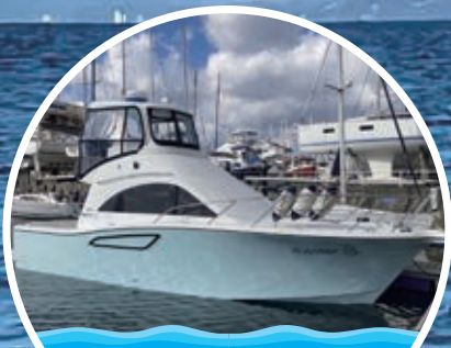
海上タクシー (乗合)