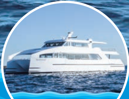
チャーター クルーズ