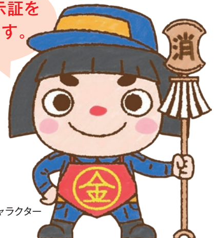
神奈川県 消防団員募集キャラクター 火けし太郎