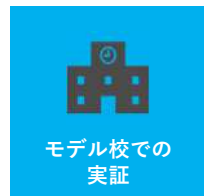
モデル校での実証