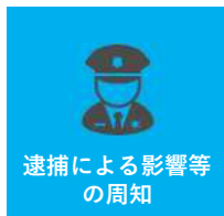
逮捕による影響等の周知