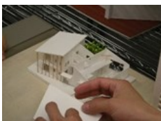
建築設計 住宅模型の製作