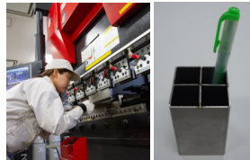
溶接・板金 曲げ・溶接体験でペン立て製作