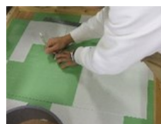
住環境リノベーション 内装仕上げ体験 (床材)