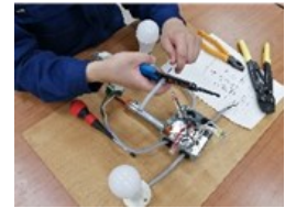
電気 電気工事体験