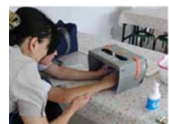
給食調理 手洗いチェッカー