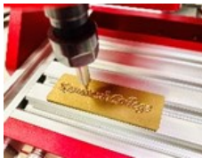
精密加工工芸 オリジナルプレート製作