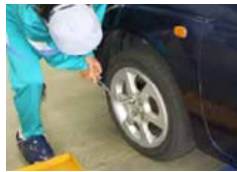
自動車整備 タイヤ点検・脱着