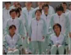
ケアワーカー 車椅子乗車体験&介助体験