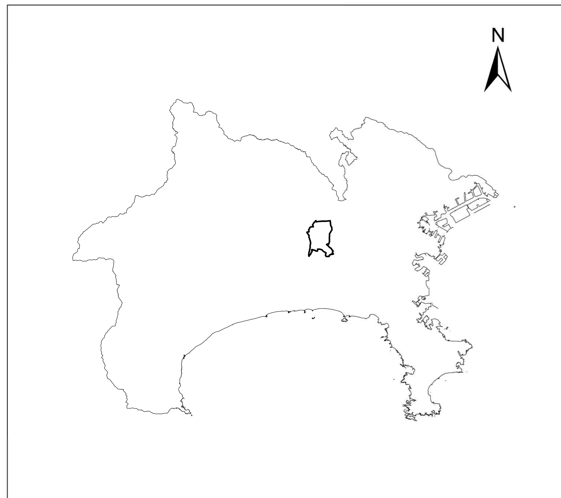
全体位置図 (S=1:500,000) (A2)