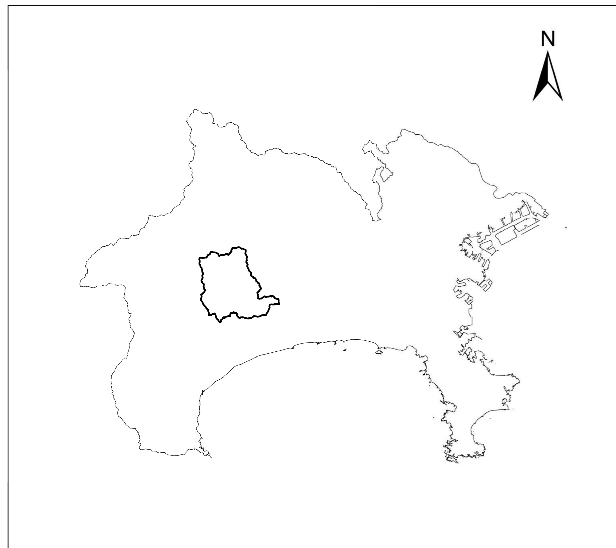
全体位置図 (S=1:500,000) (A2)