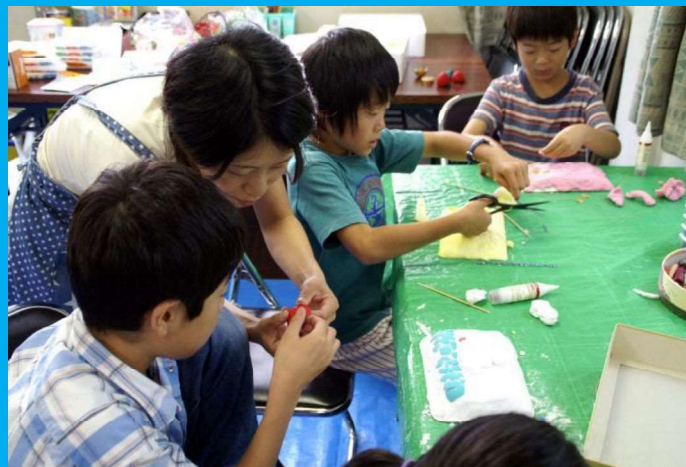
20~30年と活動してきた 心強いボランティアスタッフさんたち