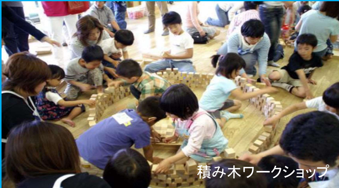
積み木ワークショップ