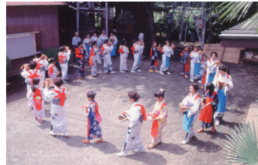
相模のささら踊り(愛甲ささら踊り盆唄保存会,1994年)

県内に広く伝えられてきた「相模のささら踊り」。Eテレの「みいつけた!」でも活躍する振付家・ダンサーのスズキ拓朗が率いるCHAiroidPLINが新たなエネルギーを吹き込みます! 盆踊りの感覚で一緒に!