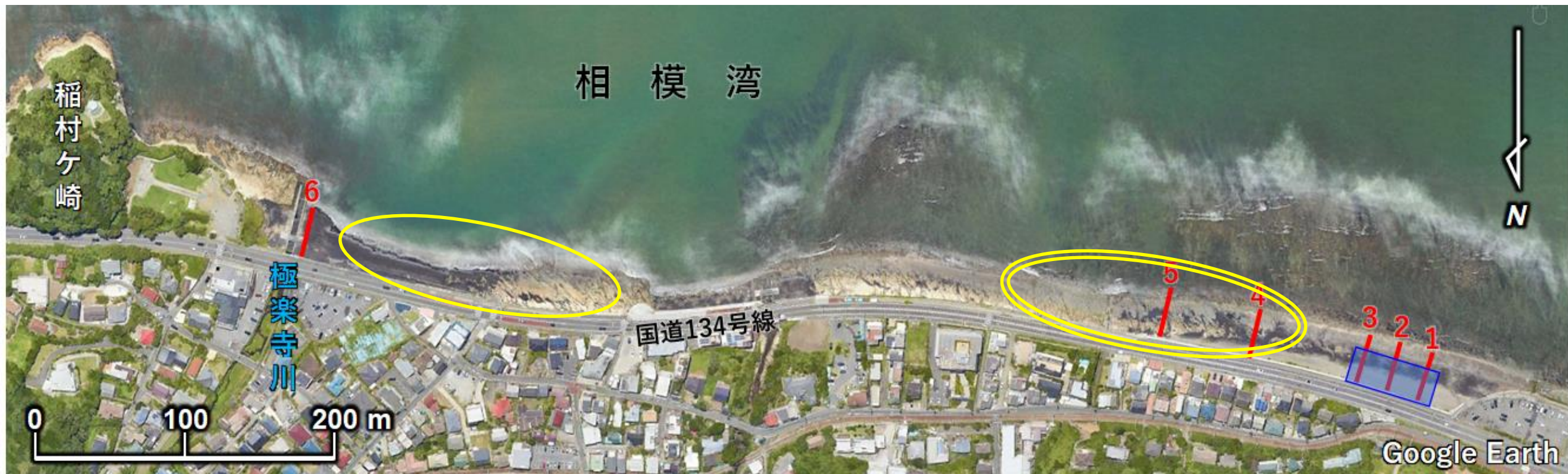
図1 令和5年度の養浜候補位置（案）