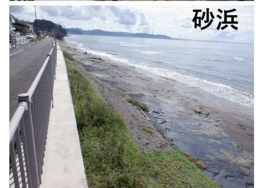
図2 令和5年度の養浜位置及び断面（案）