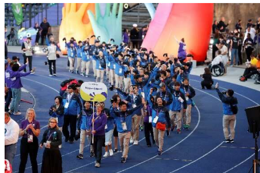
2023年夏季世界大会・ベルリン 日本選手団入場行進

〈県内の活動〉※2022年実績 年間トレーニング回数 688回（累計） 年間参加アスリート実数 347名/ボランティア99名 神奈川地区大会の開催 〈国内大会〉それぞれ4年に一度 夏季競技・冬季競技のナショナルゲーム(全国大会)に選手団 を派遣 〈世界大会〉それぞれ4年に一度 夏季競技・冬季競技のワールドゲーム(世界大会)に選手団を 派遣 ※2023年ベルリン大会には日本最多の神奈川選手団を派遣