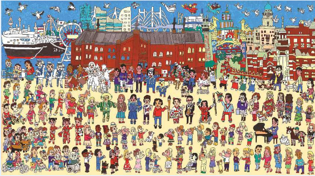
よこま 横溝 さやか さん (嬉々!! CREATIVE 所属) 作「ともに生きる日本と世界の横浜」1,000 mm × 1,800 mm