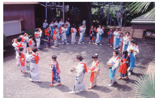
相模のささら踊り(愛甲ささら踊り盆唄保存会,1994年)

県内に広く伝えられてきた「相模のささら踊り」。Eテレの「みいつけた!」でも活躍する振付家・ダンサーのスズキ拓朗が率いるCHAiroidPLINが新たなエネルギーを吹き込みます! 盆踊りの感覚で一緒に!