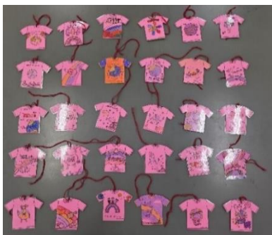
図2 ピンクシャツキーホルダー