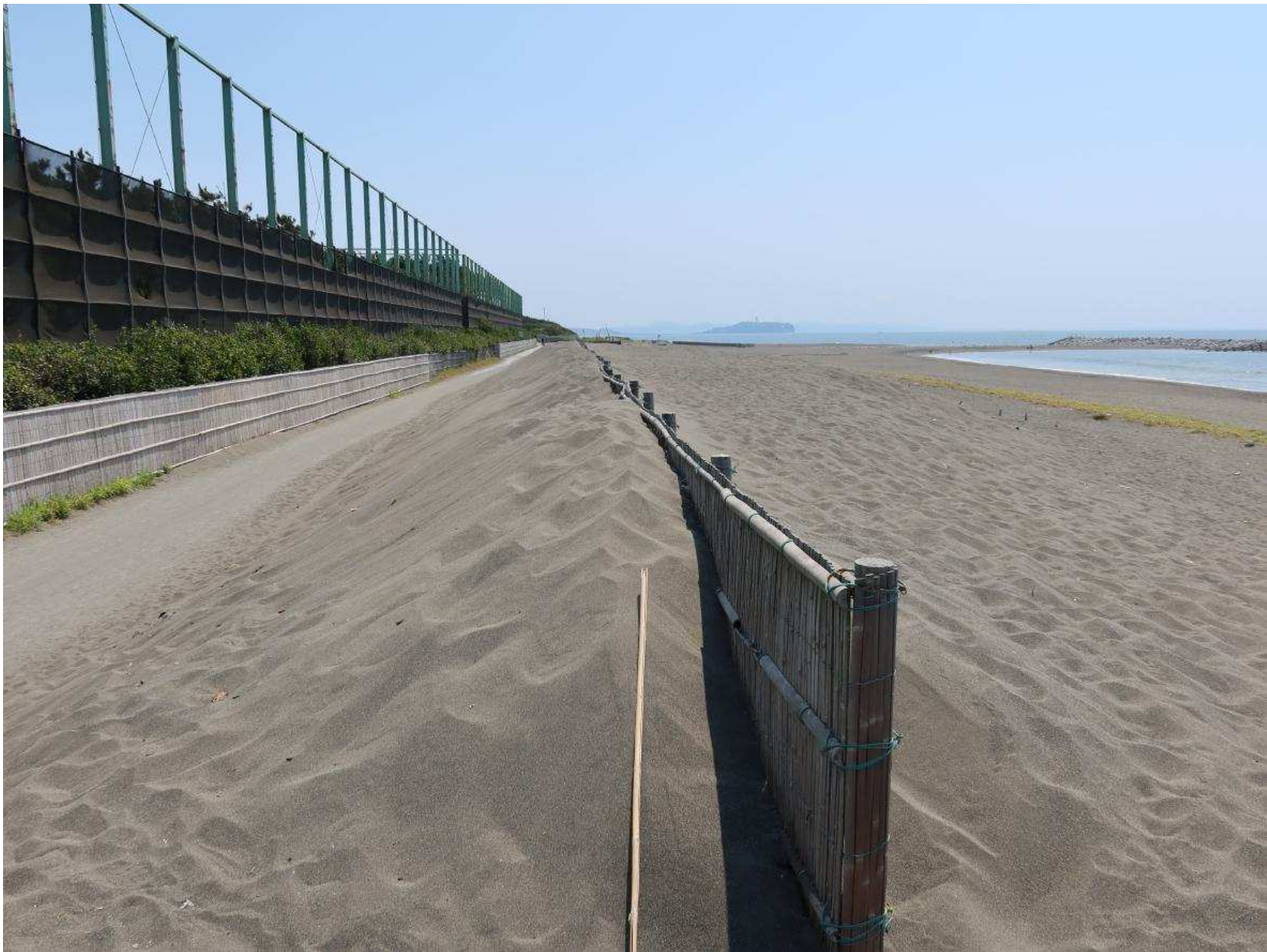
写真-8 過剰な飛砂堆積により大きく塞がった自転車道