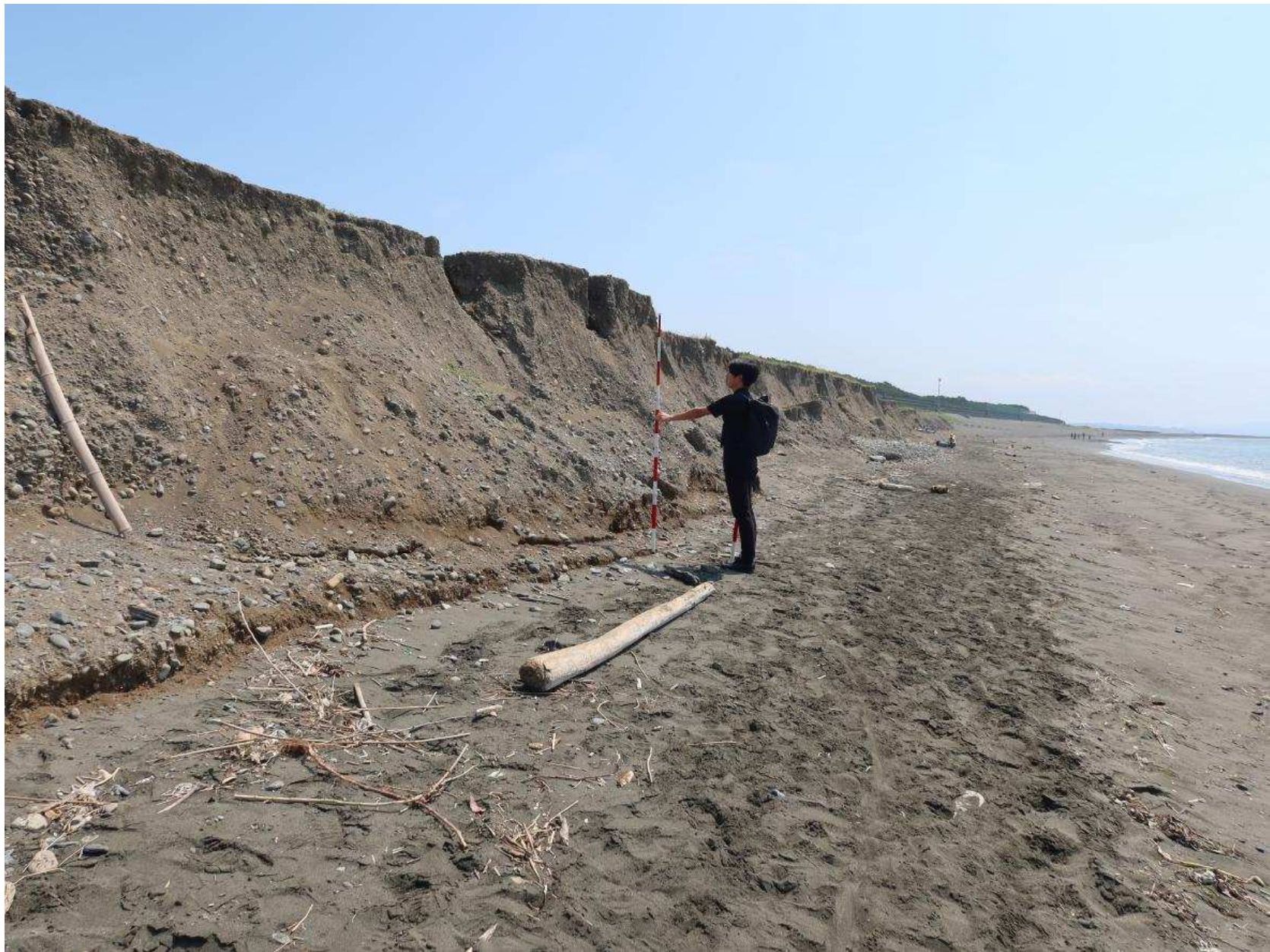
写真-3 浜崖侵食 前浜はあるが，浜崖の前面では視界が遮られている。