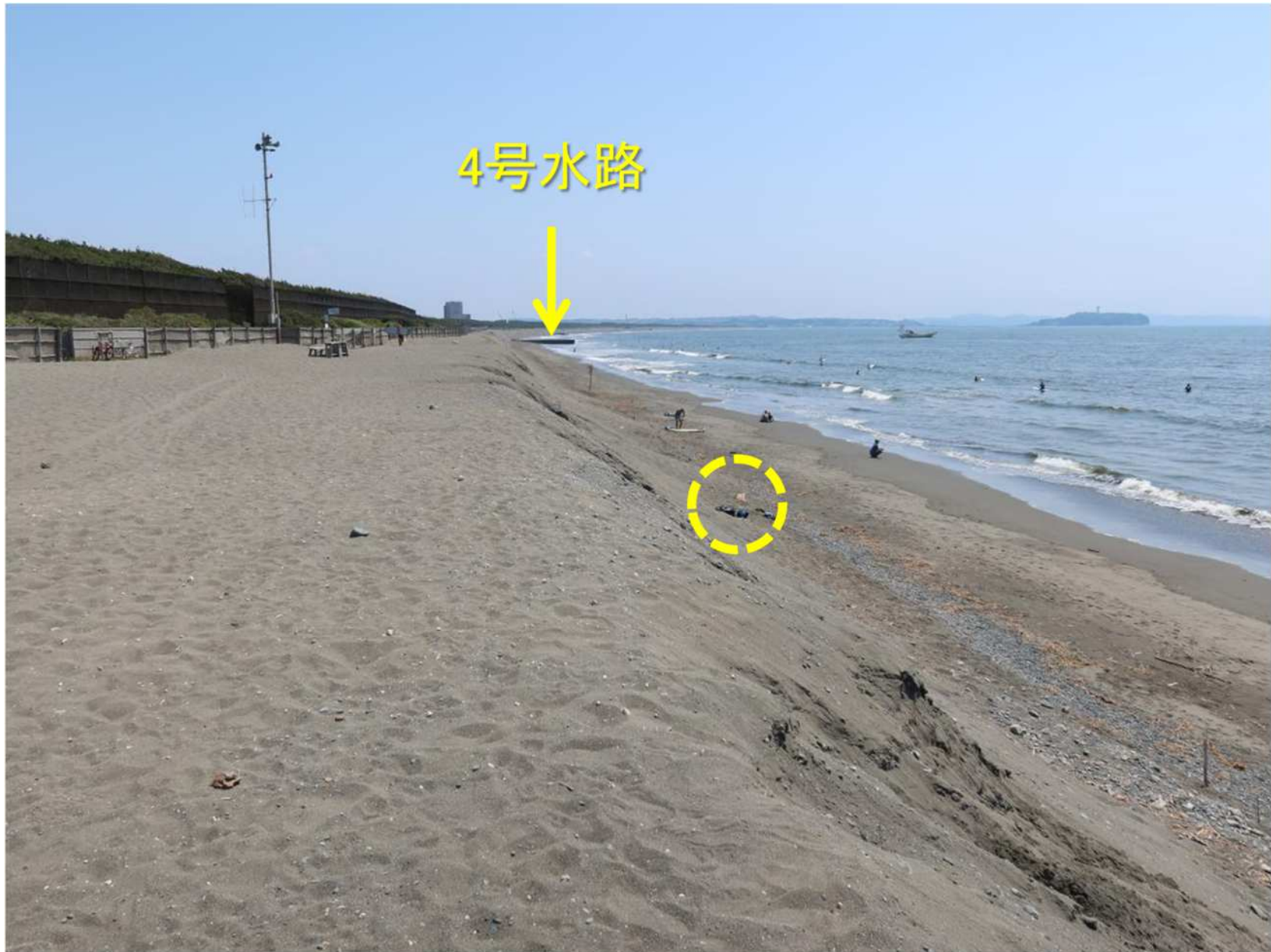
写真-13 盛り土上から4号水路方面を望む