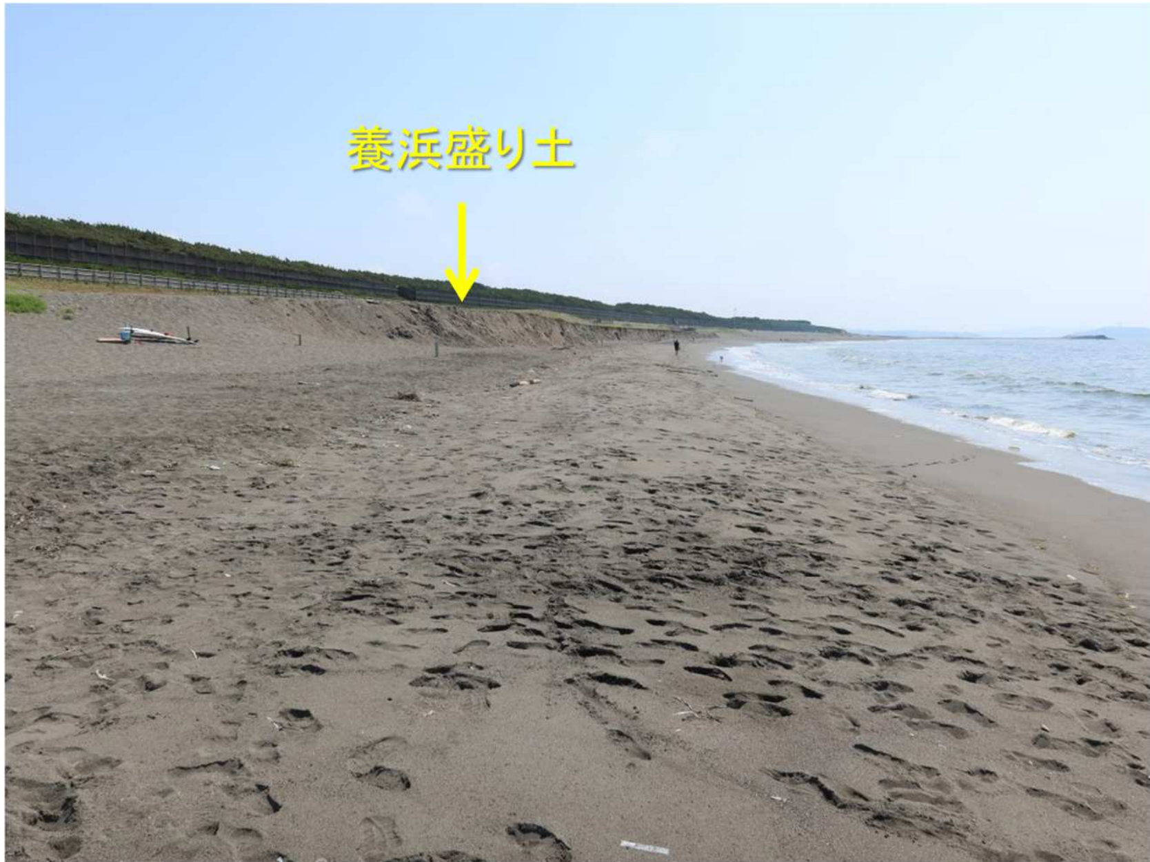
写真-1 遠方に盛り土養浜区域を望む この付近では砂が堆積してバームが形成.