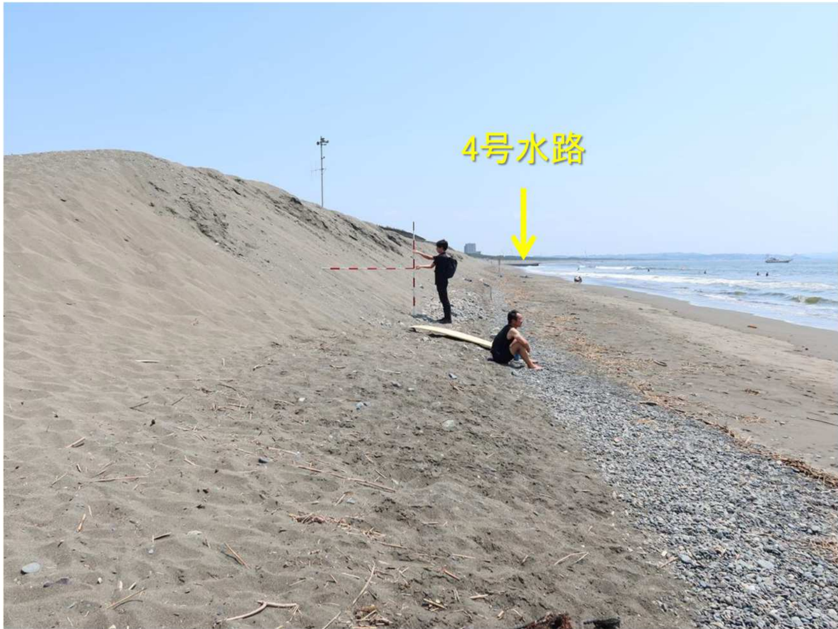
写真-12 盛り土の浜崖侵食が始まる地点の海浜状況