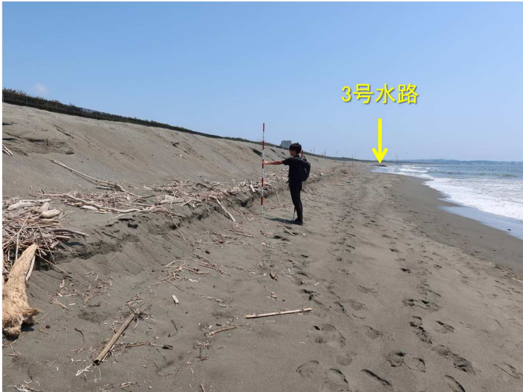
写真-21 盛り土養浜の基部で進む浜崖侵食