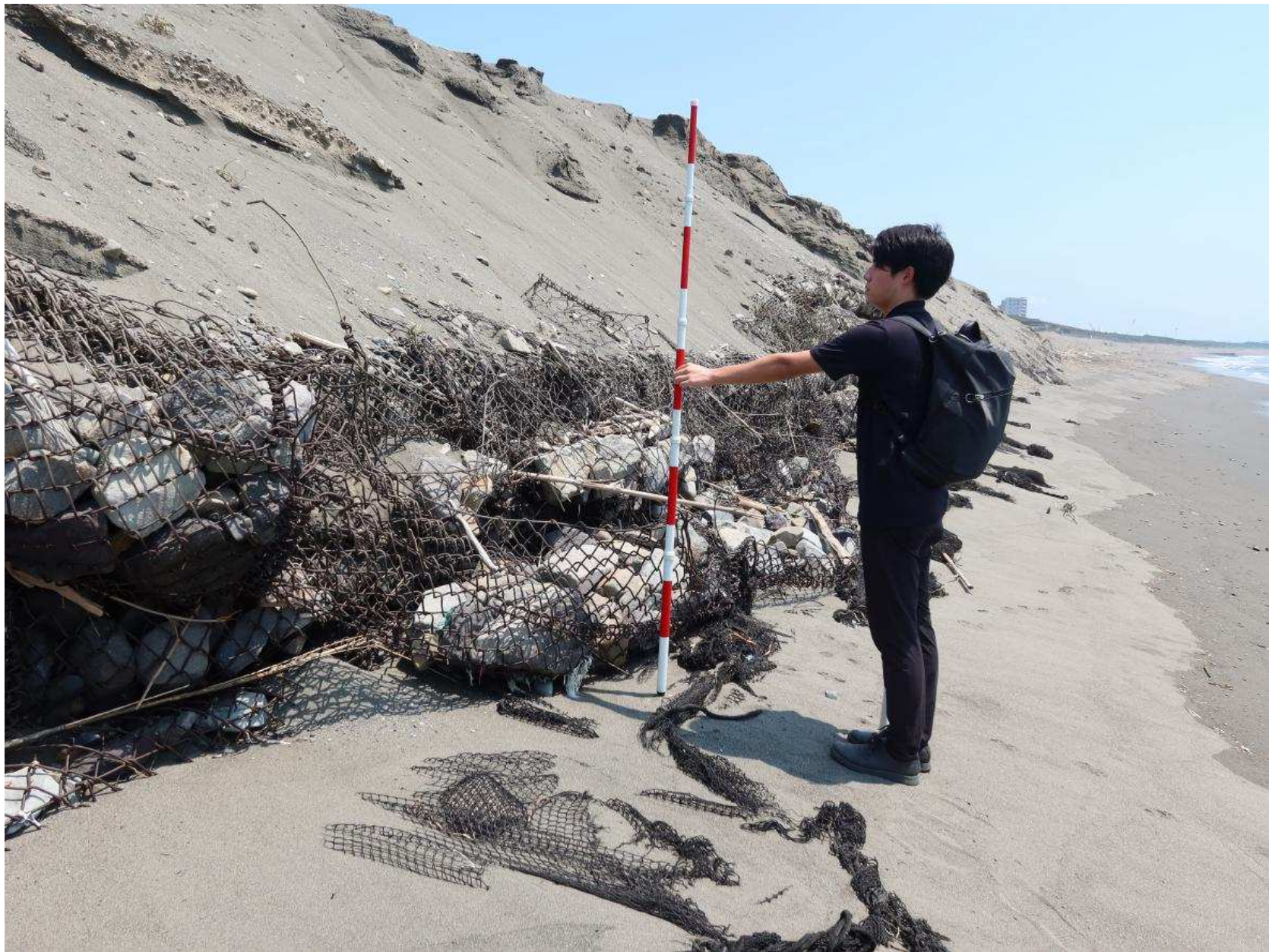
写真-19 破壊された大型フトン籠