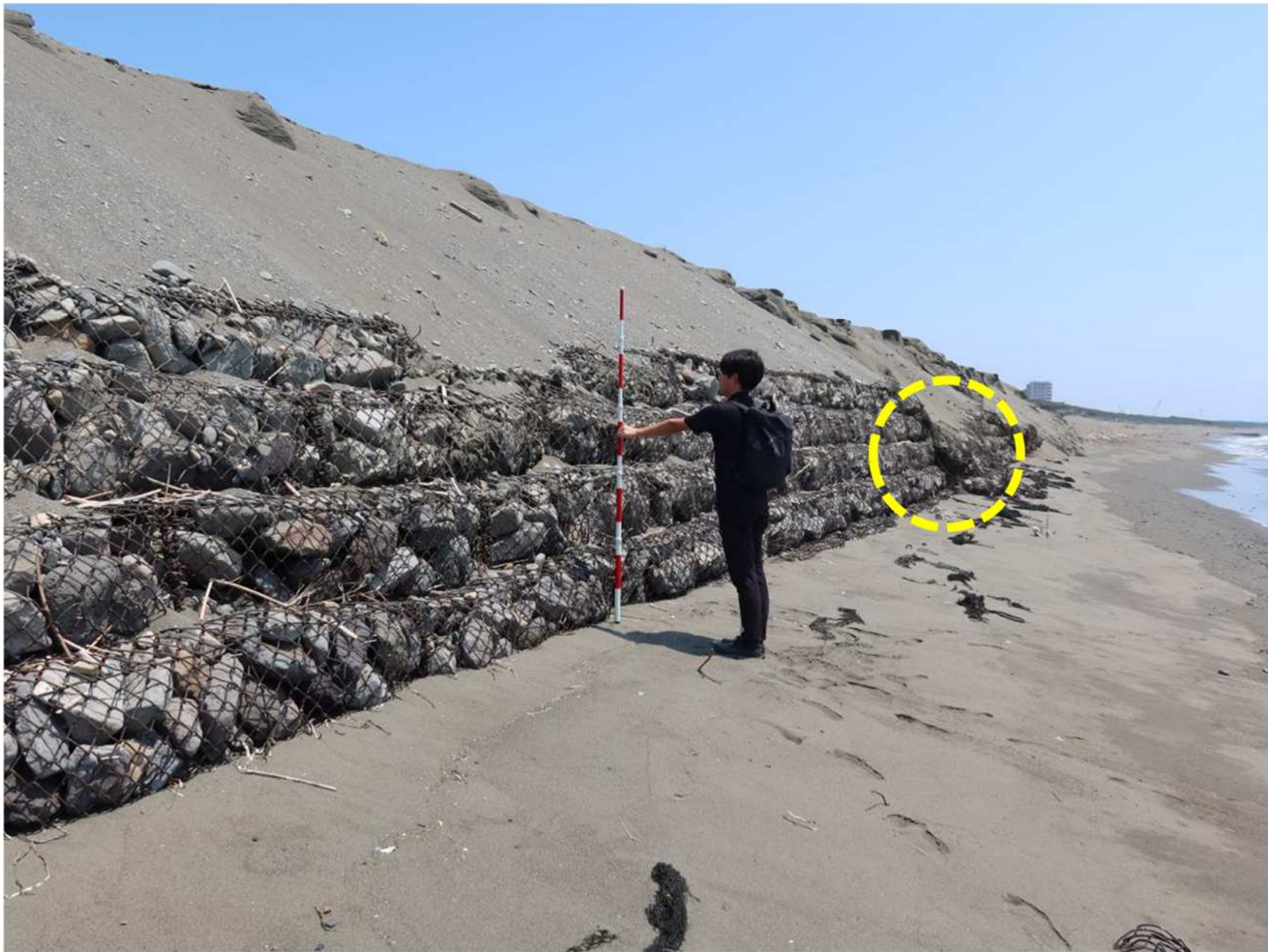
写真-18 白浜地区の大型フトン籠