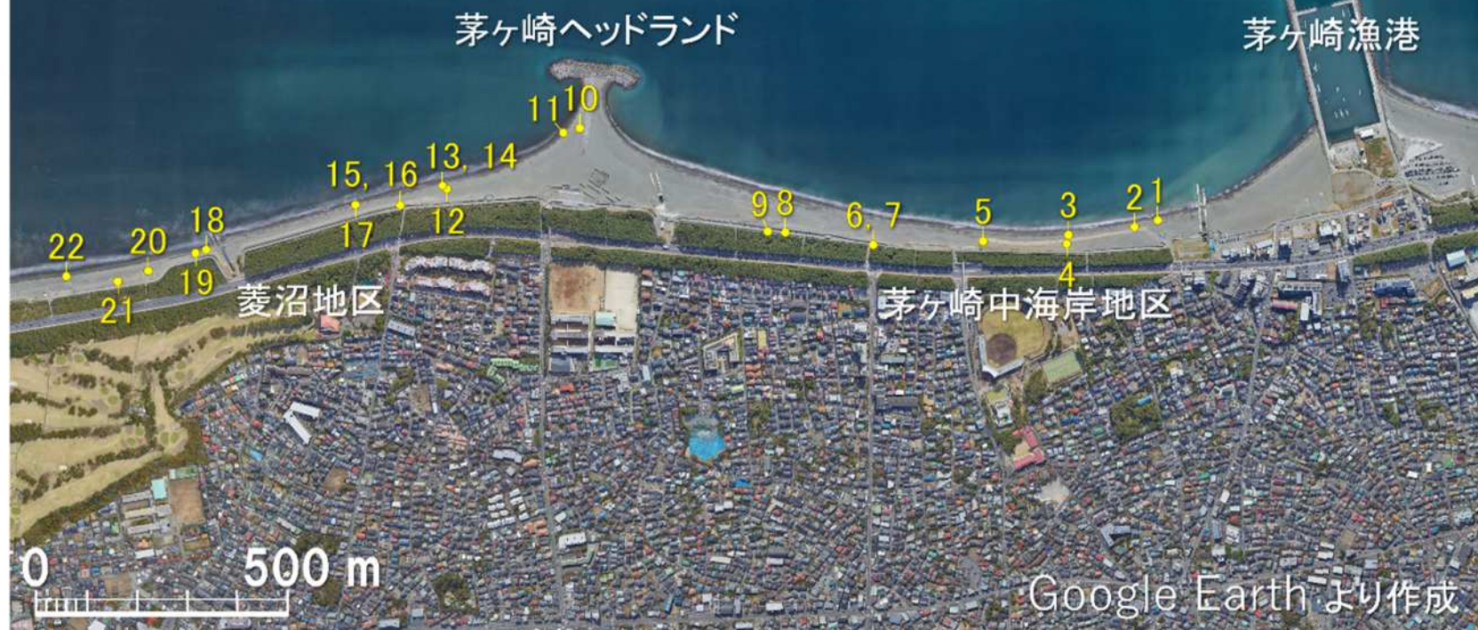
図-1 茅ヶ崎中海岸の衛星画像と写真撮影地点 (St.1～St.22)