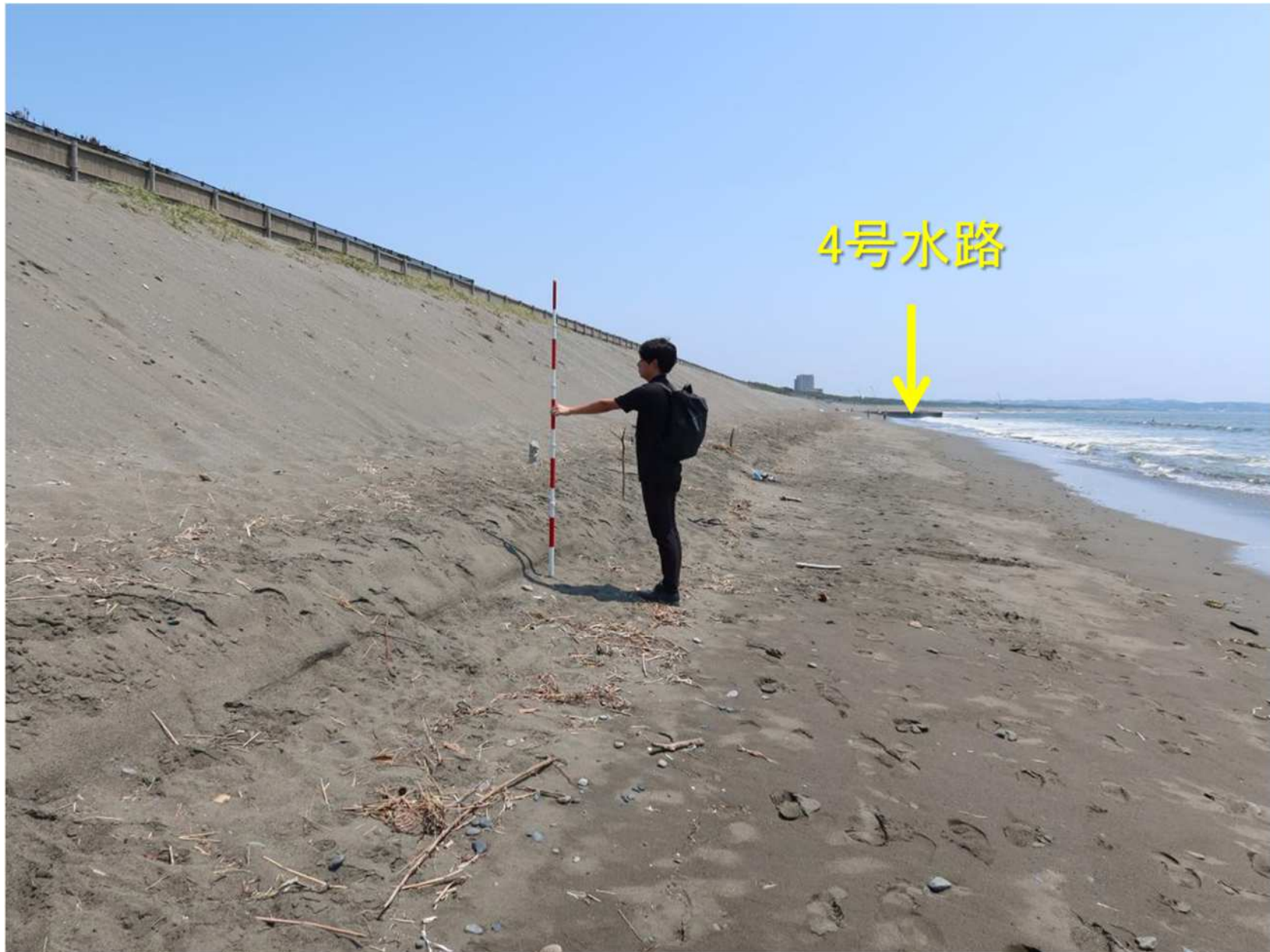
写真-16 いったんは安定化した斜面の下部で始まった小規模な侵食