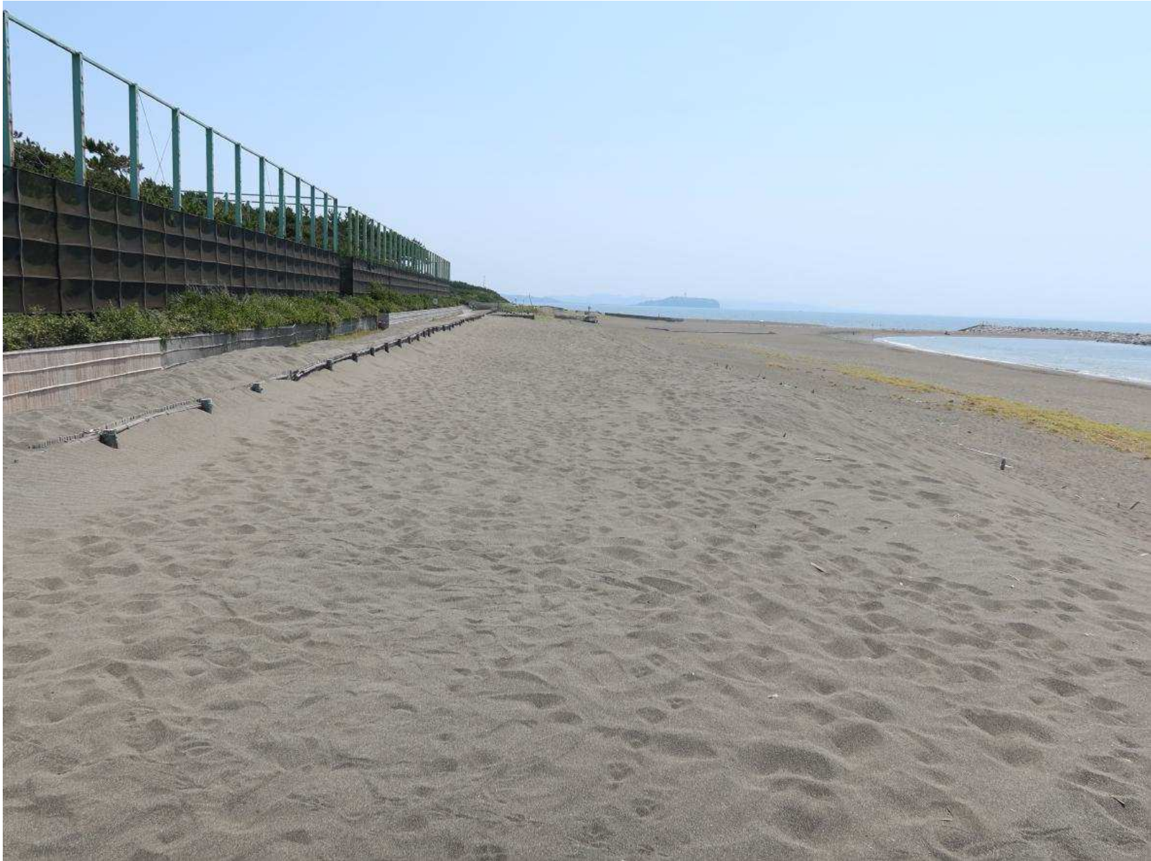
写真-9 過剰に飛砂が堆積した場所の海側にある堆砂垣外側に積まれた飛砂