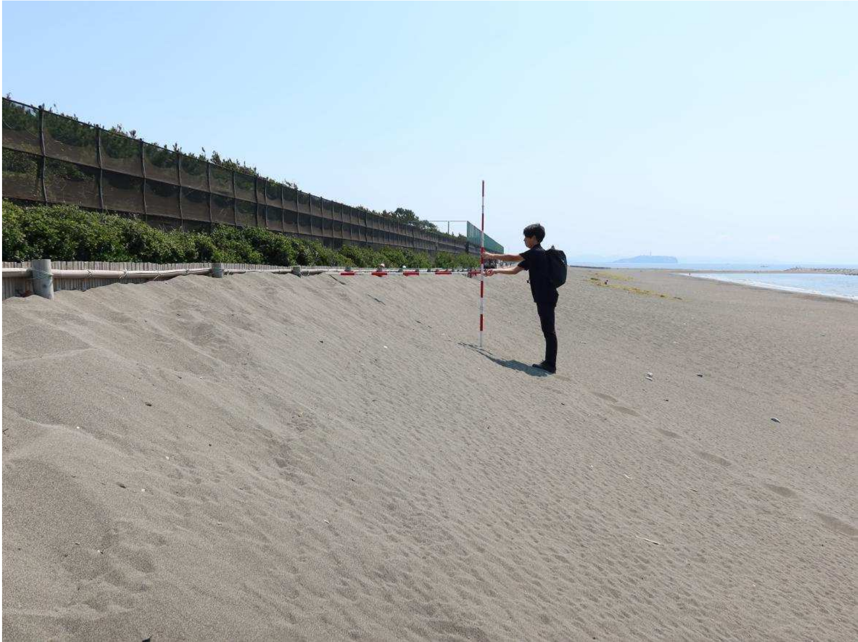
写真-6 自転車道への飛砂垣の海側に堆積した飛砂