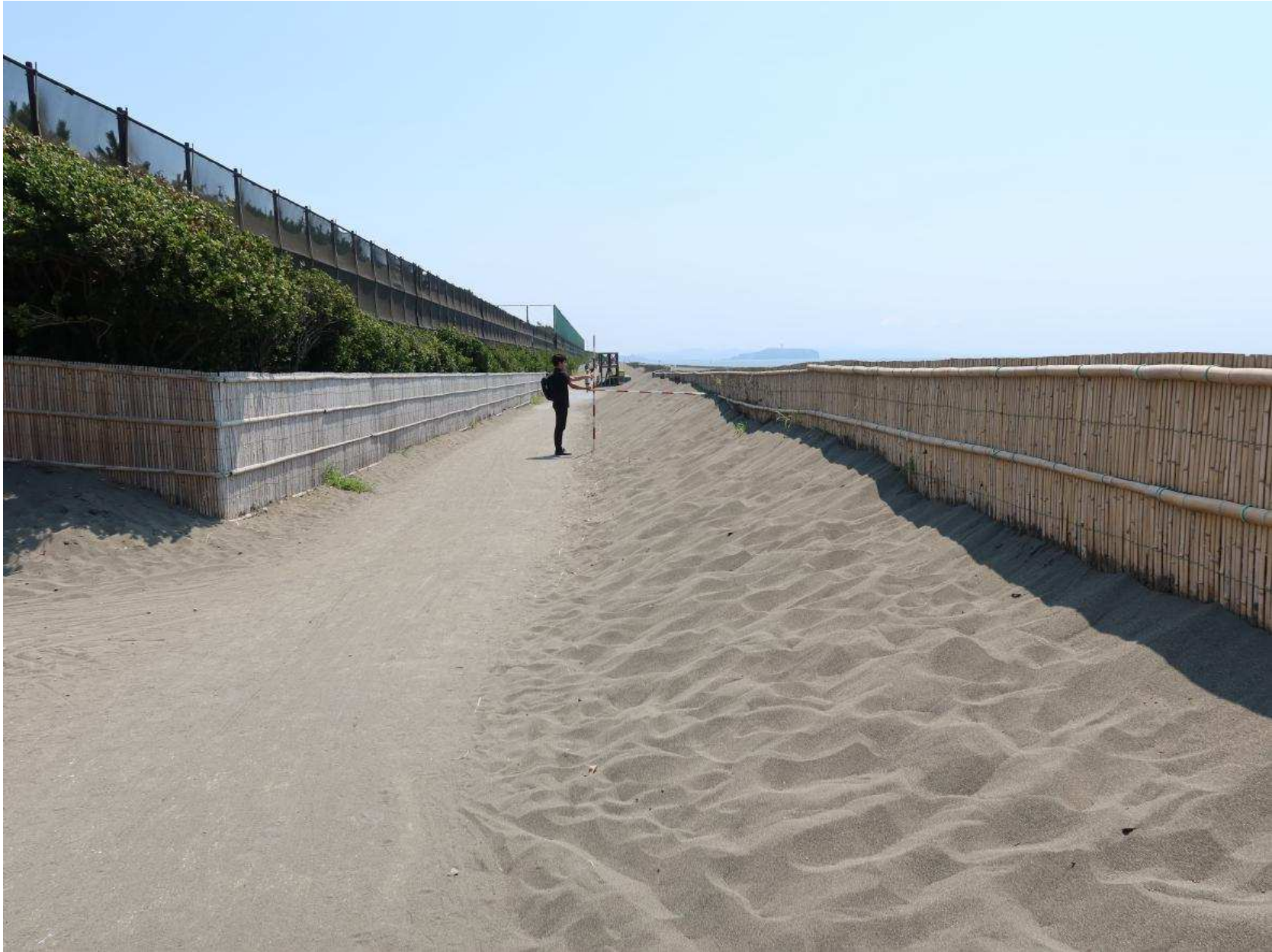
写真-7 堆砂垣を越えて自転車道へ入り込んだ飛砂