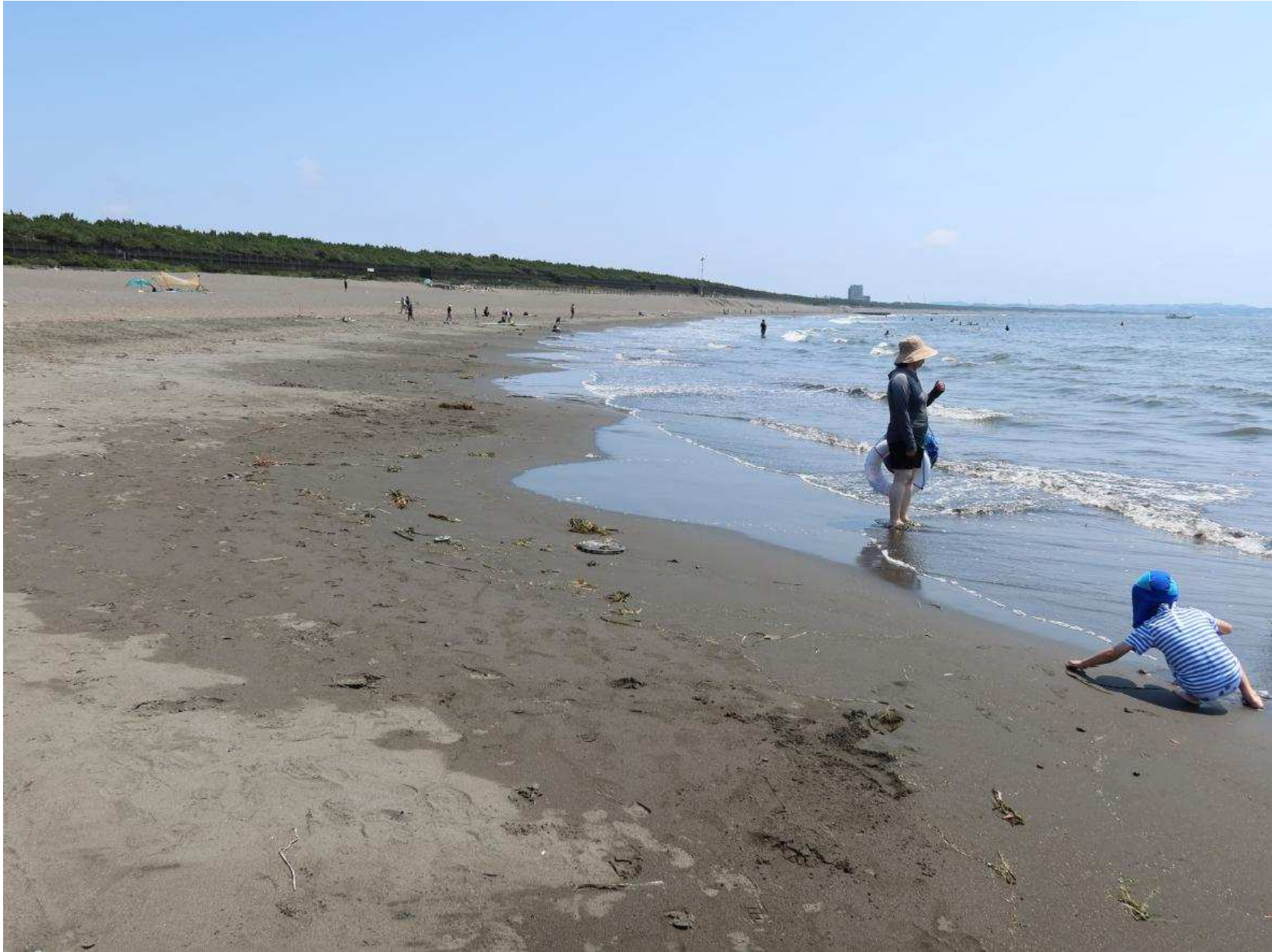
写真-11 茅ヶ崎ヘッドランド東側の利用空間