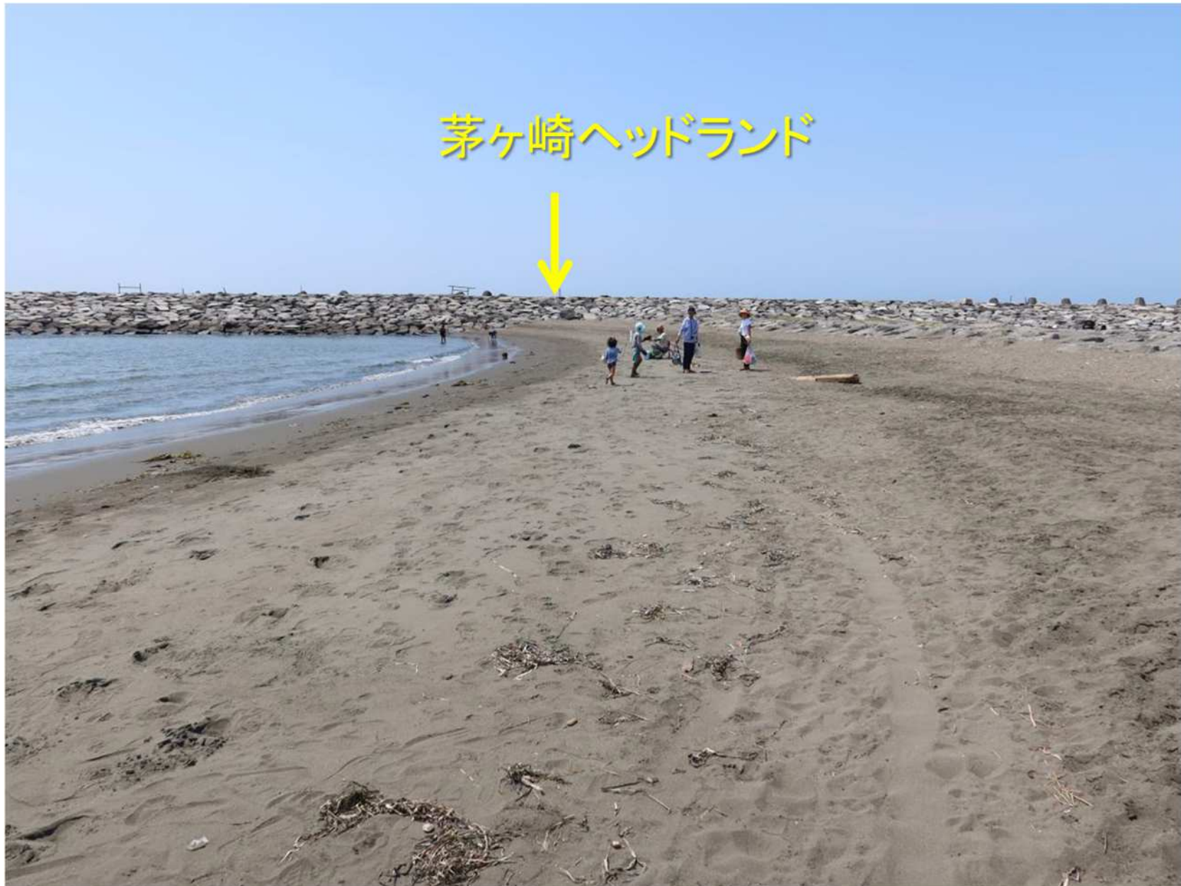
写真-10 茅ヶ崎ヘッドランドの東側側面