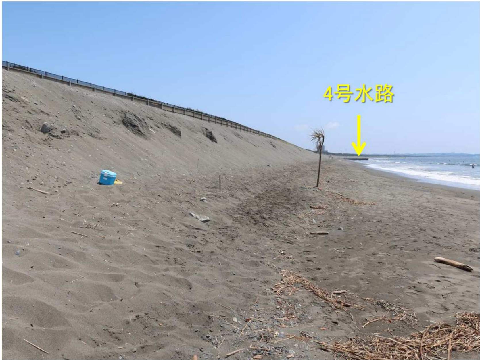
写真-15 一連の浜崖形成区域 斜面は安定化しつつある.