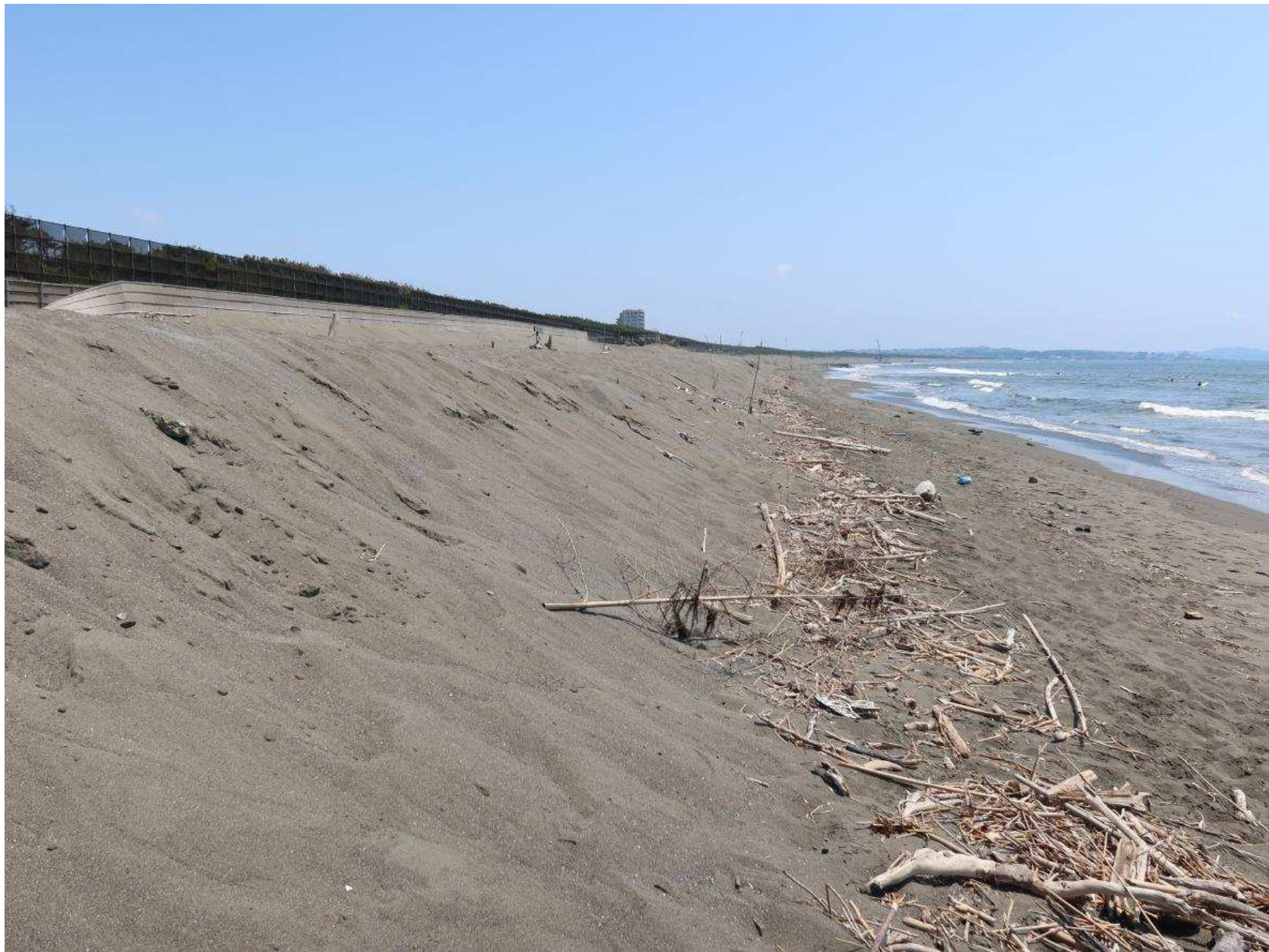
写真-20 4号水路東側の養浜盛り土の前面に堆積した流木