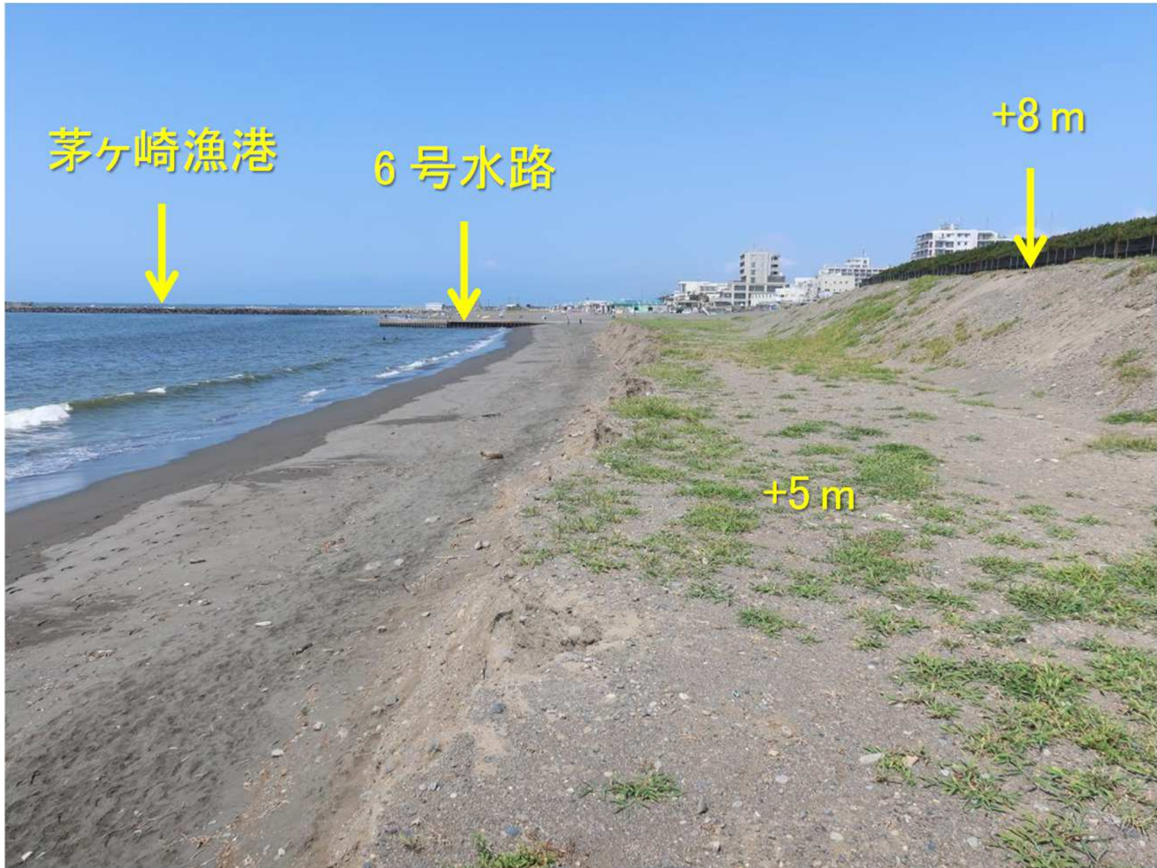
写真-4 盛り土上から西向きに望む 高さ+5 mの天端は+8mから下げられている.