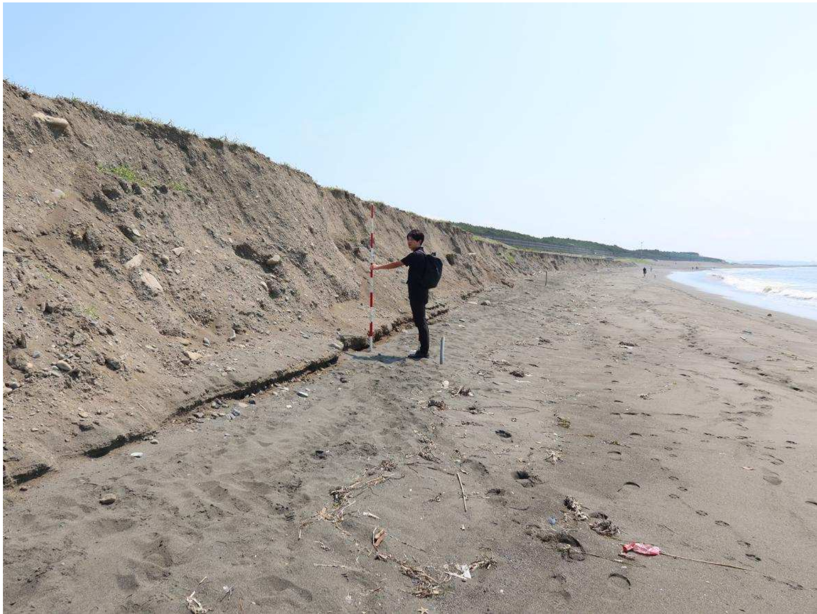
写真-2 鉛直に近い浜崖 前浜の背後に垂直な崖が迫る