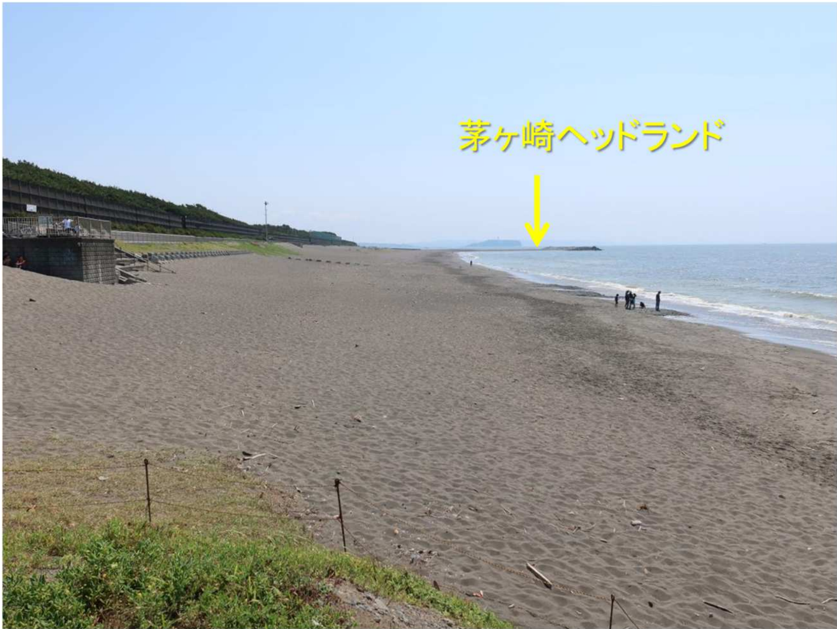
写真-5 養浜砂が堆積した中海岸地先東部 自然海浜と変わらない.