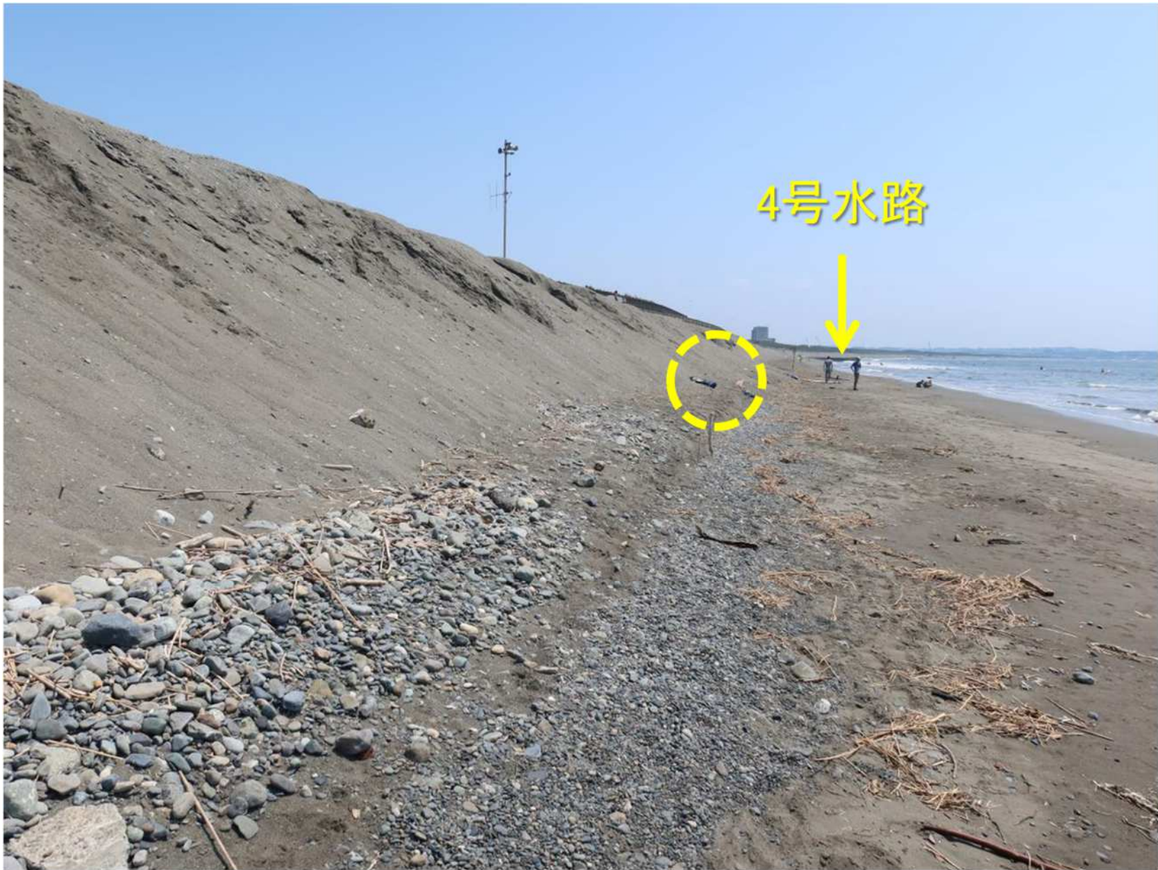
写真-14 浜崖の基部の状況（写真-13に○で示した場所）