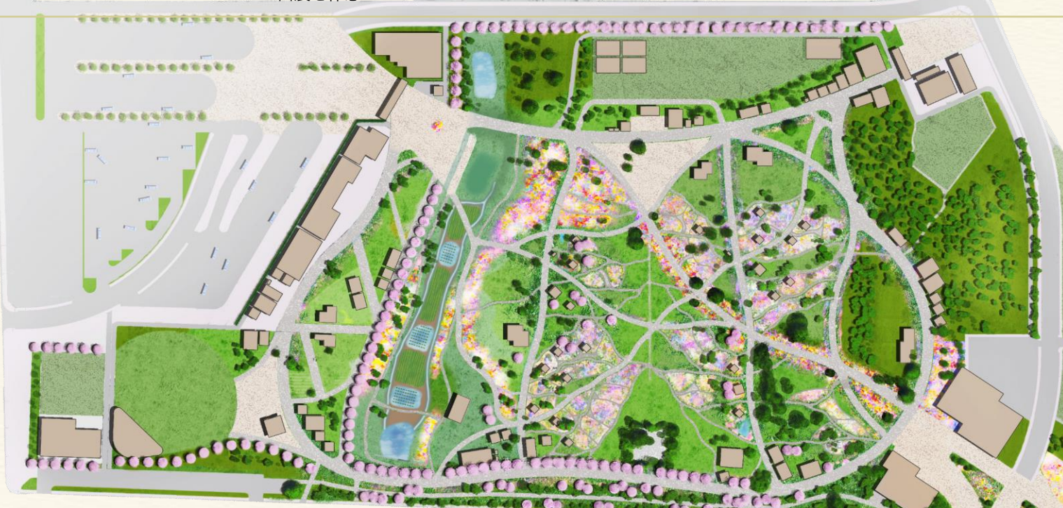
2023年1月現在 会場イメージ 今後の調整状況により変更になる可能性がある。