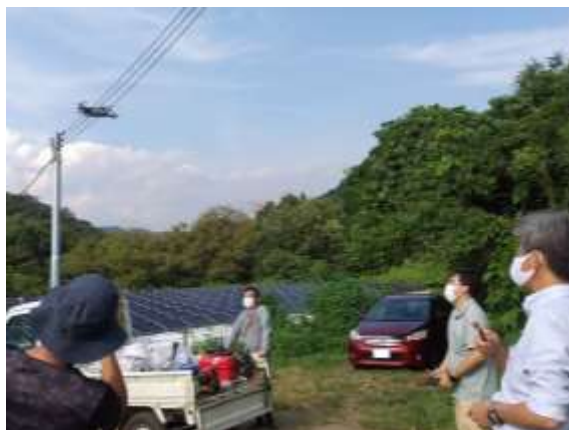
図 3-2 かながわ鳥獣被害対策支援センターによるドローンを活用した集落環境調査

地域による対策が非常に困難な場合や、対策の実施主体である市町村の実施体制（人員、予算）が十分でない場合、県は、計画の目標の達成状況等の実態に応じ、市町村と連携した対策の強化や支援等を検討する。