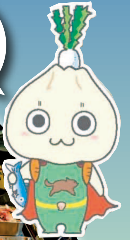
県の食育マスコット かなふう