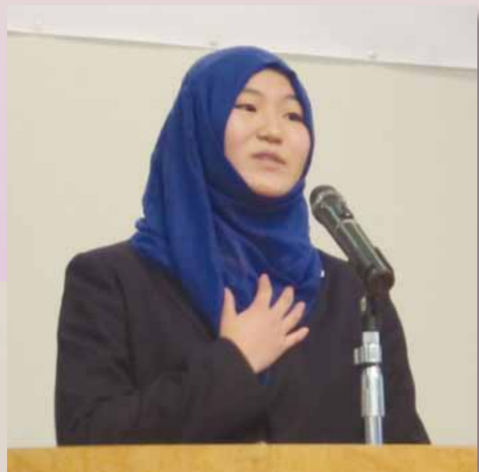
平成28年度 総合部門スピーチ

Kanagawa Prefecture Senior High School English Speech Contest 2017