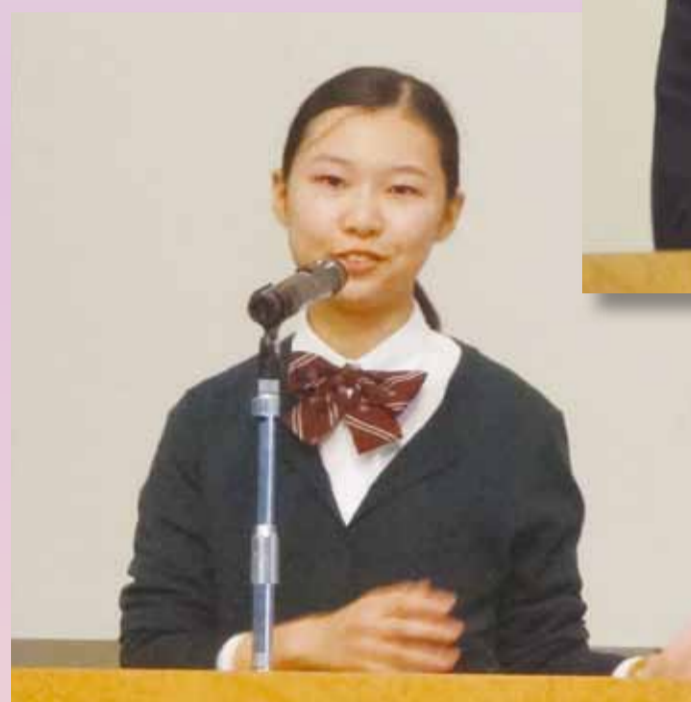
平成28年度 一般部門スピーチ