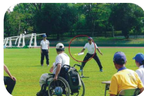
障がい者フライングディスク競技体験会

一般に「フリスビー」などと呼ばれるディスクを、直径91.5cmの円形ゴールに投げて、10回中何回通すことができるかを競う「アキュラシー」という種目を体験できます。簡単そうに見えますが、意外と難しい競技です。ぜひこの機会に体験してみましょう!