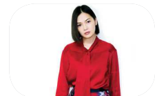
yui (FLOWER FLOWER)