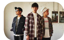
ベリーグッドマン