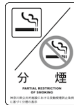
Áreas designadas para fumadores

かながわけん いんしょくてん りよかん おくない きん 神奈川県では飲食店やホテル・旅館などの屋内の禁煙・分煙を定めています。飲食店などを利用する際は表示の確認をして、ルールを守ってください。