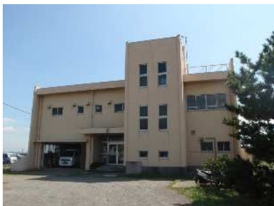
A 大磯港管理事務所