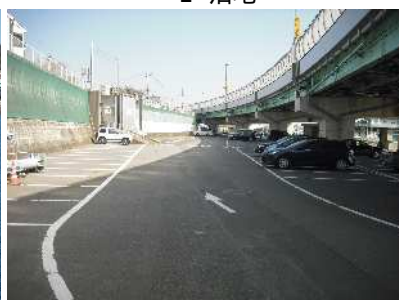
F 臨港道路附属駐車場