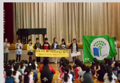
児童朝会での発表

春には、カラスノエンドウ・スズメノエンドウ・セイヨウタンポポ・チョウ・テントウムシなどを、秋には、カワラノギク・カヤネズミ・色々な種類のバッタ・キリギリス・コオロギなどを見つけました。見つけたことを発表し合い、相川のすばらしい自然とは何かをみんなで考えました。子ども達は、相川の自然の豊かさは、生きものの種類の多さであることを発見することができました。地域の自然を大切にすることを養う活動にもなりました。