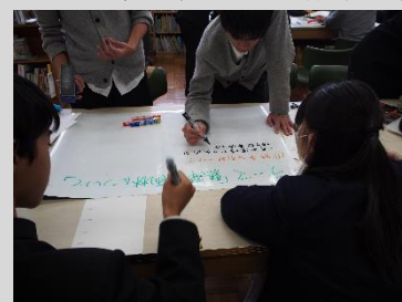
公開研究授業の様子

平成28年は、その実践事例として生物基礎の「生物多様性と生態系」の単元で、「生態系のバランスと保全」についての県内高等学校教員を対象とした公開研究授業を大和高等学校で実施し、その様子を『高等学校教育課程研究集録』にまとめ、環境教育の普及を図りました。