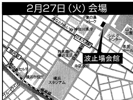
波止場会館 (横浜市港湾労働会館) (4階大会議室 1・2) 横浜市中区海岸通1-1 みなとみらい線 日本大通り駅 徒歩5分 JR根岸線 関内駅 徒歩15分