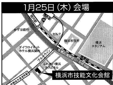
横浜市技能文化会館 (8階 802大研修室) 横浜市中区万代町2-4-7 JR根岸線関内駅 南口 徒歩5分 横浜市営地下鉄ブルーライン伊勢佐木長者町駅 出口2 徒歩3分