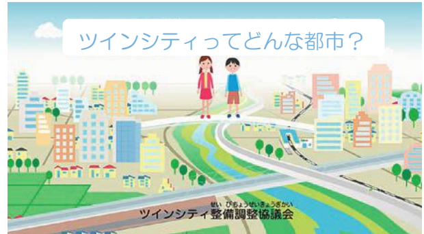
「ツインシティってどんな都市?」

https://www.youtube.com/watch?v=wufGJs71M30