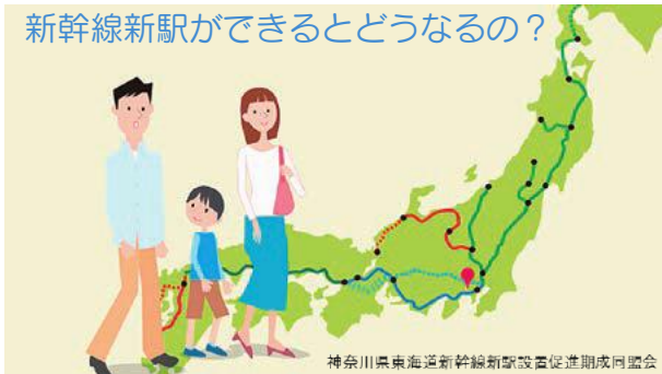
「新幹線新駅ができるとうなるの?」