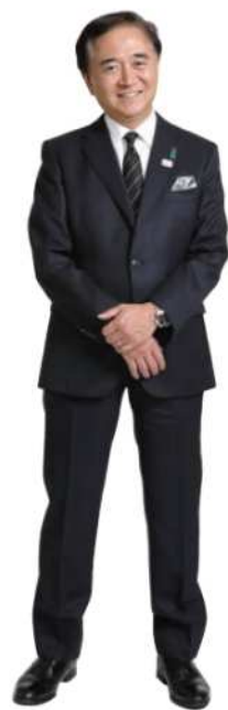
かながわ子どものみらい応援団 団長 黒岩 祐治 神奈川県知事