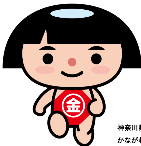
神奈川県PRキャラクター かながわキンタロウ