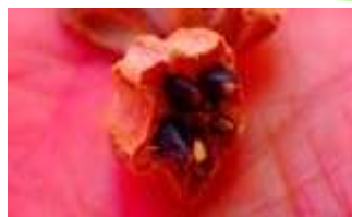
センダンの種子を見る