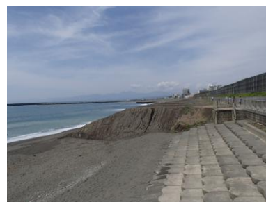
養浜(茅ヶ崎市中海岸)