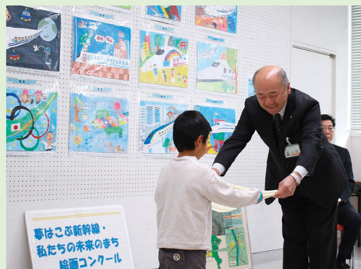
絵画コンクール表彰式

小学生を対象とした絵画コンクール、横断幕の掲出、広報誌の発行など、幅広い普及啓発を行っています。