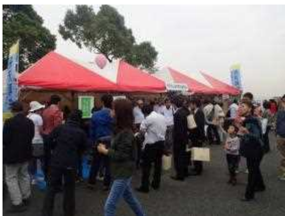
ワールドフェスタ・ヨコハマ 2015 への ブース出展（自然再生委員会主催）