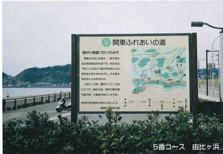
5番コース 由比ヶ浜