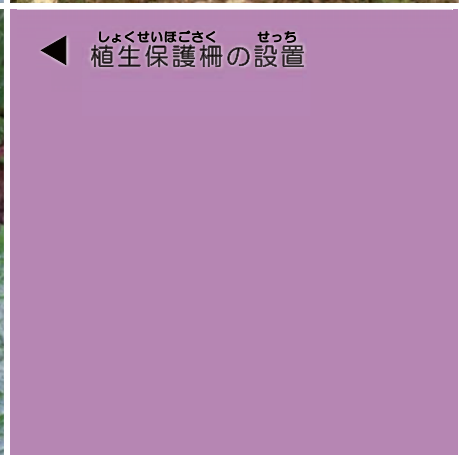
植生保護柵の設置