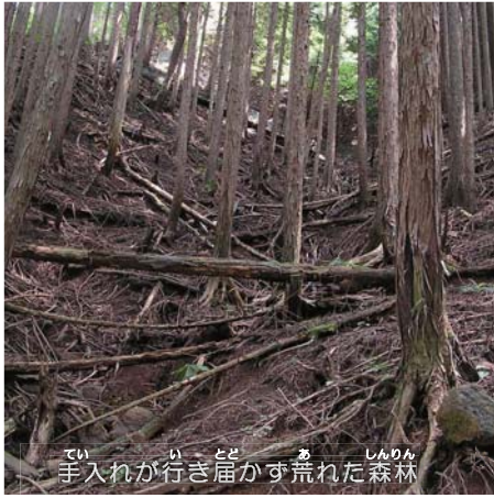
手入れが行き届かず荒れた森林

私たち自然環境保全センターは、お山のかいだんのほかにも、丹沢大山の自然を再生させるためにさまざまな仕事をしています。私たちの活動にもっとも興味をもっていただき、協力していただけるとうれしいです！