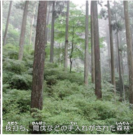
枝打ち、間伐などの手入れがされた森林