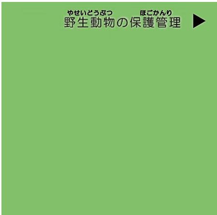
野生動物の保護管理