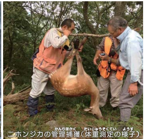
ニホンジカの管理捕獲(体重測定の様子)