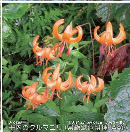
柵内のクルマユリ(県絶滅危惧種IA類)