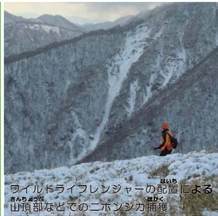
ワイルドライフレンジャーの配置による山頂部などでのニホンジカ捕獲