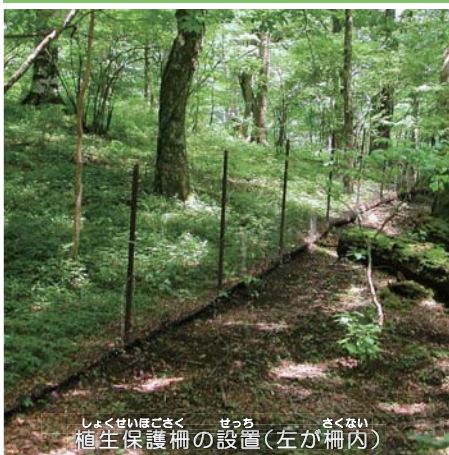
植生保護柵の設置(左が柵内)