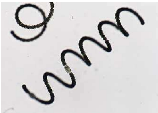
* 4 アナベナ（藍藻類）