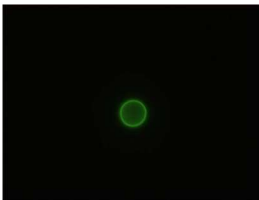
* 1 クリプトスポリジウム (落射蛍光顕微鏡による画像)

企業団の綾瀬浄水場は相模川を、伊勢原浄水場及び相模原浄水場は主に酒匂川 (注5) を水源としています。相模川及び酒匂川は、水道水源としては比較的良好な水質の河川です。