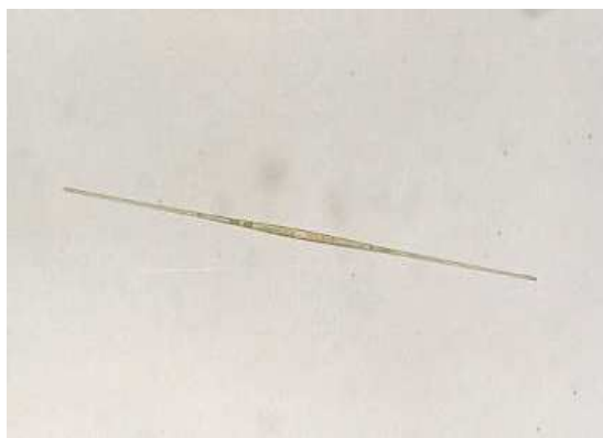
* 2 シネドラ（珪藻類）