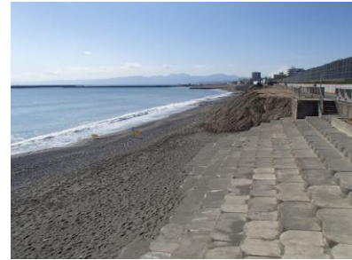
養浜(茅ヶ崎市中海岸)