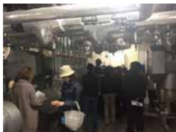
マンション設備見学会