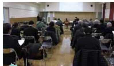
マンション管理セミナー