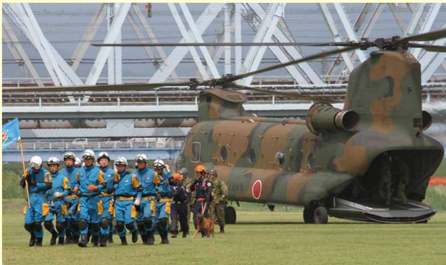
ビッグレスキューかながわ (県・市町村合同総合防災訓練)

県・市町村と住民、消防、警察、自衛隊、医療機関などが連携する 災害医療支援訓練を行い、大規模災害に備えます。