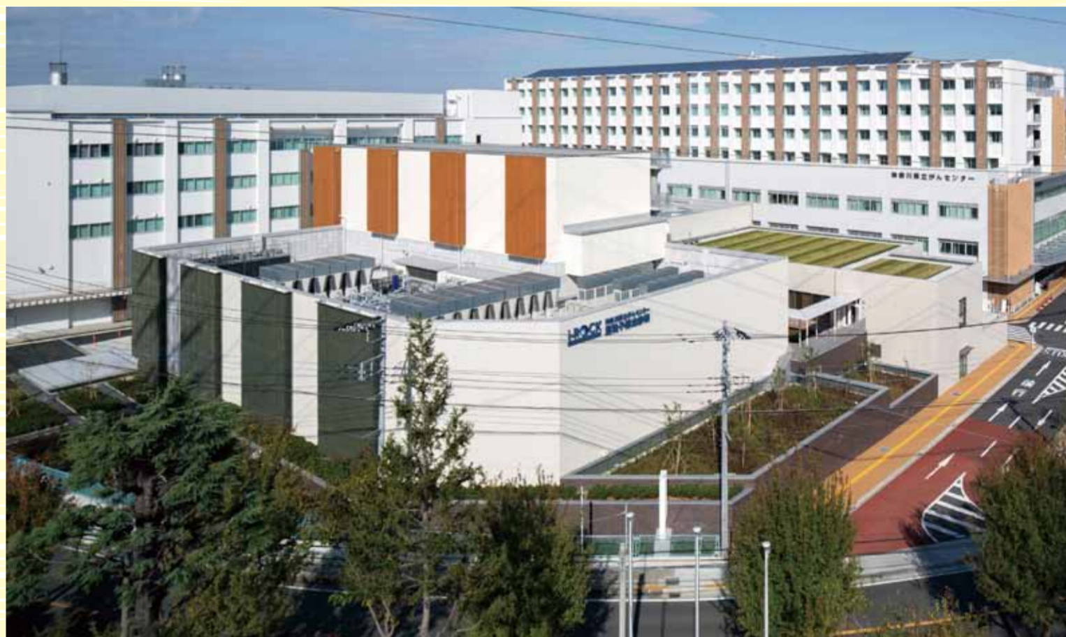
県立がんセンター 重粒子線治療施設 i-ROCK (アイロック)

県・市町村と住民、消防、警察、自衛隊、医療機関などが連携する 災害医療支援訓練を行い、大規模災害に備えます。